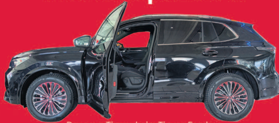
Der neue Tiguan beim Tiguan Fanday