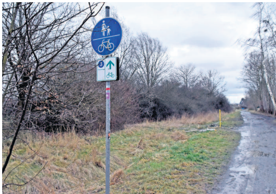
Der Landwehrweg ist ein ausgewiesener Rad- und Wanderweg. Er führt vom Wohngebiet „Am Sandberg“ parallel zur Badstraße in die Innenstadt von Radeberg.

Der Landwehrweg zwischen dem Wohngebiet am Sandberg und der Pulsnitzer Straße dient als verkehrsberuhigte Verbindung parallel zur Badstraße in Radeberg. Fußgänger und Radfahrer können hier abseits des Autoverkehrs fahren bzw. spazieren. Anrainer sind zudem Kleingärten und ein Unternehmen sowie Wohnhäuser.