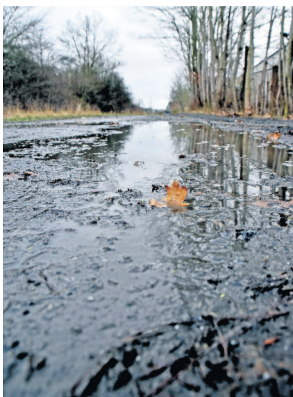
Bei Schnee und Regen verwandelt sich der Landwehrweg in eine Pfützen- und Matschlandschaft und kann kaum genutzt werden.