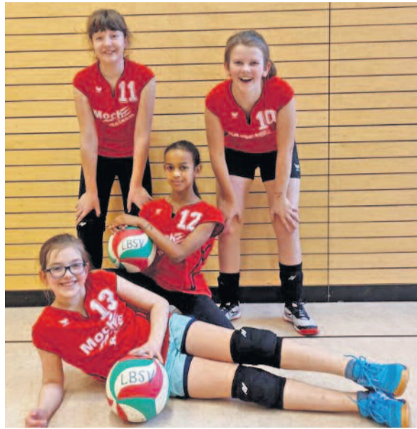
Die U 13 Mädels des Langebrücker Vereins.

Am 04. Februar fand der zweite Spieltag in der U13 statt. Draußen war es regnerisch und trüb. Kurzum, man möchte eigentlich lieber im Bett bleiben. Auf der Hinfahrt zur Sporthalle ist es entsprechend still im Auto. Ursprünglich waren für jede Mannschaft drei Spiele geplant. Leider konnte in der Staffel eine Mannschaft aufgrund von Krankheit nicht antreten. Das bedeutet für die Volleyballmädchen des Langebrücker Ball-sportvereins (LBSV) nunmehr ein Spiel weniger und jede Menge Wartezeit mehr, denn die Spiele der fehlenden Mannschaft wurden durch später geplante Spiel ersetzt. Den ersten Satz verschliefen die Mädels gegen die zweite Mannschaft vom DSSV. Wo waren nur die Bewegungen zum Ball und die guten Aufschläge vom ersten Spieltag geblieben? Im zweiten Satz konzentrierte man sich, die Aufschläge landeten immer öfter im gegnerischen Feld und auch eigene Punkte auf der Anzeigentafel. Leider wurde auch dieser Satz