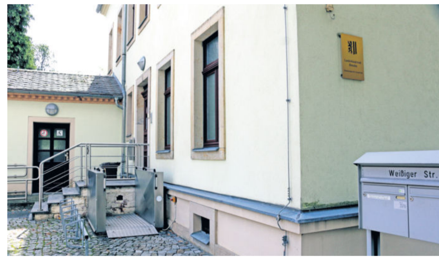
Der Besuch in der Langebrücker Verwaltungsstelle ist derzeit untersagt.