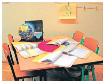
Das Lernen muss nun vorerst bis zu den Osterferien zu Hause stattfinden.

Lernaufgabe kleben die Kinder an ein Fenster in ihrer Wohnung oder dem Haus einen ausgeschnittenen Handabdruck. Gemeinsam mit den Eltern wird ein Foto gemacht und bei Instagram hochgeladen. Wie viele Fenster werden wir sehen? Wie viele Likes wird es geben? Natürlich können auch Radeberger Bürgerinnen und Bürger Fotos von Fenstern mit bunten Händen machen und posten - die Kinder werden damit für die Eigeninitiative mit einem „Gefällt mir“ / „Like“ belohnt.