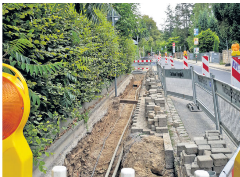
Bauarbeiten auf dem Gehweg in der Beethovenstraße.

Die zweite Maßnahme betrifft die Beethovenstraße, hier gibt es aktuell massive Einschränkung des Fahrverkehrs. Heißt, die Baustelle ist nur in eine Fahrtrichtung passierbar, zudem gibt es hier aktuell keinen starken Durchgangsverkehr. Straßenschilder kündigten seit Anfang August an, dass auf der Beethovenstraße gebaut wird. Nun ist es so weit. Träger der Baumaßnahmen ist die DREWAG. Es werden verschiedene Leitungssysteme überprüft, eventuell entflochten oder ersetzt. Geplant wird mit der Verlegung und der Erneuerung von Leitungen im Fußweg, danach schließen sich Kanalisationsarbeiten an. Die Anwohner wurden bereits über die Einschränkungen informiert. Das Bauende ist für Ende September (39. Kalenderwoche) vorgesehen. syg/geb