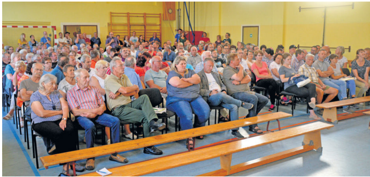
Rund 200 Interessierte nahmen am Montag an der Informationsveranstaltung zur Gemeindefusion in der Turnhalle Lichtenberg teil.

Kann die Zukunft gemeinsam gestaltet werden?