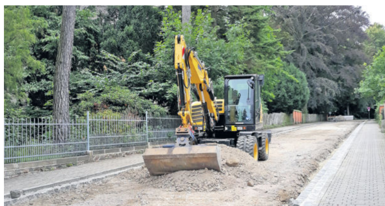
Auf dem hinteren Teil der Moritzstraße wird derzeit zwischen Blumenstraße und Steinweg die Fahrbahn erneuert.