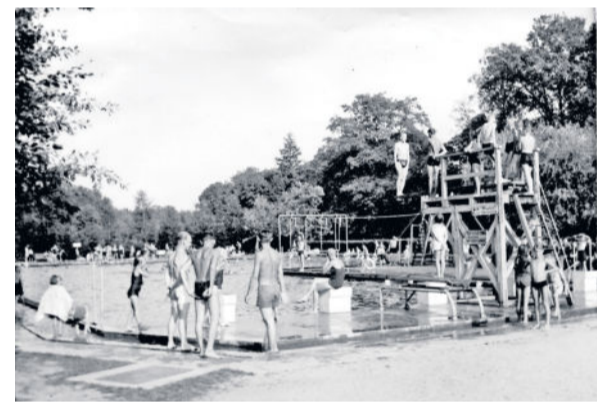
Ab ins kühle Nass - Das Karswaldbad in den 50er/60er Jahren.