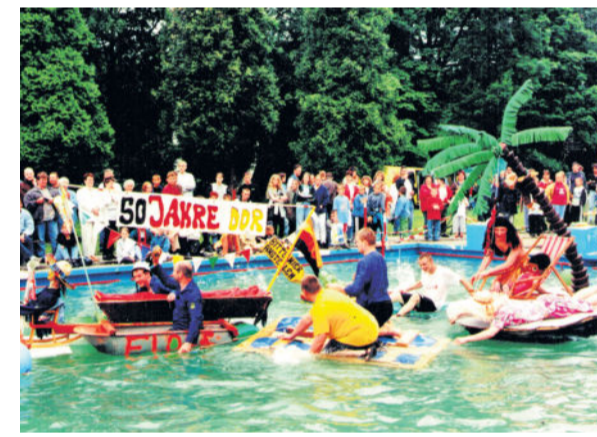
Seit 1997 ist die alljährliche Floßregatta ein fester Programmpunkt des Badfestes und sorgt für jede Menge Hingucker auf dem Wasser.