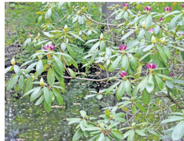
Berühmt ist der rund 1,1 Hektar große Park auch für die über 100 Jahre alten Rhododendren.

gewinnen. Er hat sich auf unsere Nachfrage nicht zum Geschehen geäußert. Die Richterin des Landgerichts Görlitz wird sich nun nach der erwähnten ersten Anhörung noch einmal mit dem Fall auseinandersetzen. Ende Juni