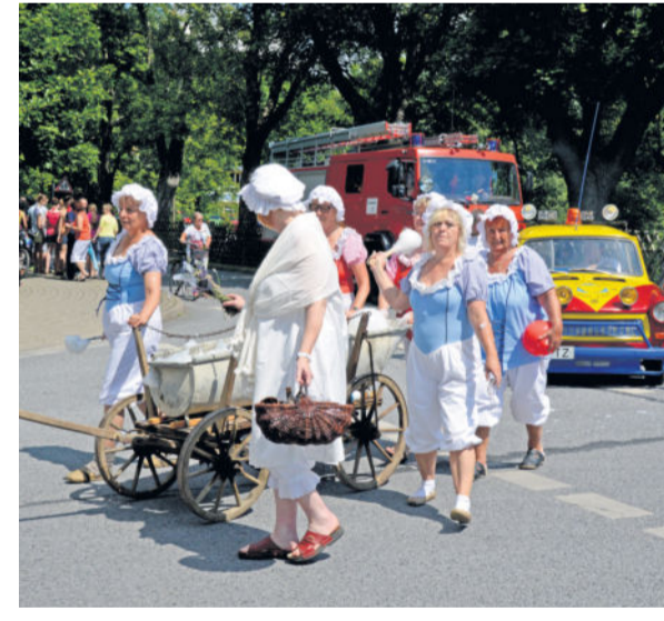
2014 wurde der 80. Geburtstag groß gefeiert. Der kleine Umzug durch Arnsdorf war eines der vielen Höhepunkte des Festes.