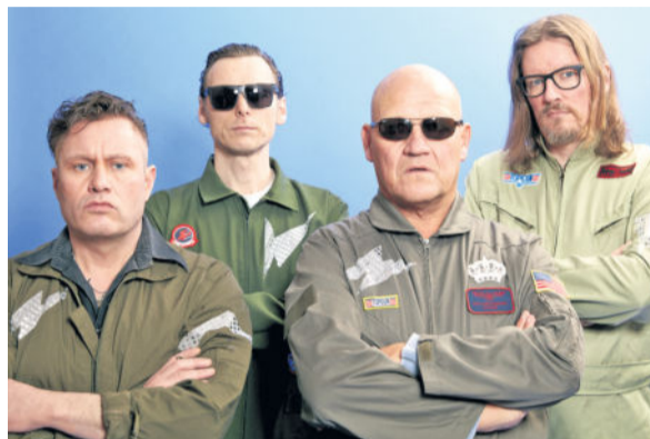
Pressefoto: Freuen sich auf das Sommerfest im Epilepsiezentrum Kleinwachau: Mitarbeiter, Bewohner und Schüler des Epilepsiezentrums Kleinwachau.

Doch nicht nur auf der Haupt-Bühne ist eine Menge los. Ein vielfältiges Programm erwartet die Gäste zwischen