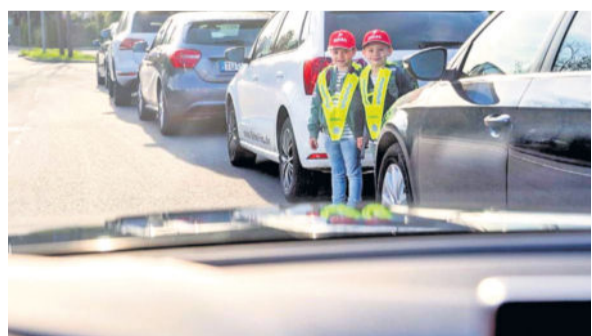
Fahrt mit dem Elterntaxi: Oft zusätzliches Gefahrenpotenzial

Straßenverkehr zu sammeln und entsprechende Kompetenzen zu erwerben. Das „Elterntaxi“ müsse, wenn es sich nicht vermeiden lasse, zumindest so organisiert werden, dass niemand im schulischen Umfeld gefährdet werde. Der DEKRA Verkehrssicherheitsreport 2019 ist online unter www.dekra.de/verkehrssicherheitsreport verfügbar. Weitere Inhalte finden sich unter www.dekra-roadsafety.com . DEKRA Info