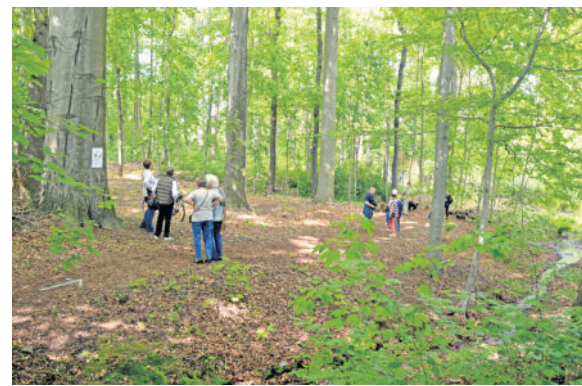
Rund 150 Besucher kamen zum Tag der offenen Gärten in den Forellenwald.

gericht Görlitz. Dabei wurden beide Seiten angehört und auch das Gegengutachten der Kneips vorgelegt, welches die Standsicherheit der Bäume bestätigt. Auch die untere Naturschutzbehörde wurde aktiviert und um Stellungnahme gebeten. Die Experten sprechen sich aufgrund des Biotopcharakters weitestge-