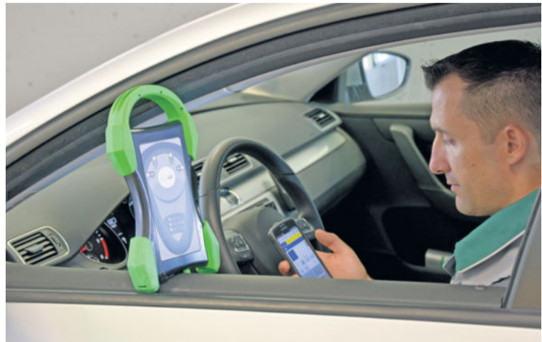
Brisante Ware: Wem gehören die Daten im Fahrzeug?

Die Expertenorganisation DEKRA hat zusammen mit anderen Prüforganisationen mit Blick auf das anbrechende Zeitalter des automatisierten und vernetzten Fahrens den ungefilterten Zugang zu den Daten in Fahrzeugen gefordert: „Die sicherheits- und umweltrelevanten Daten, die in den Fahrzeugen entstehen,