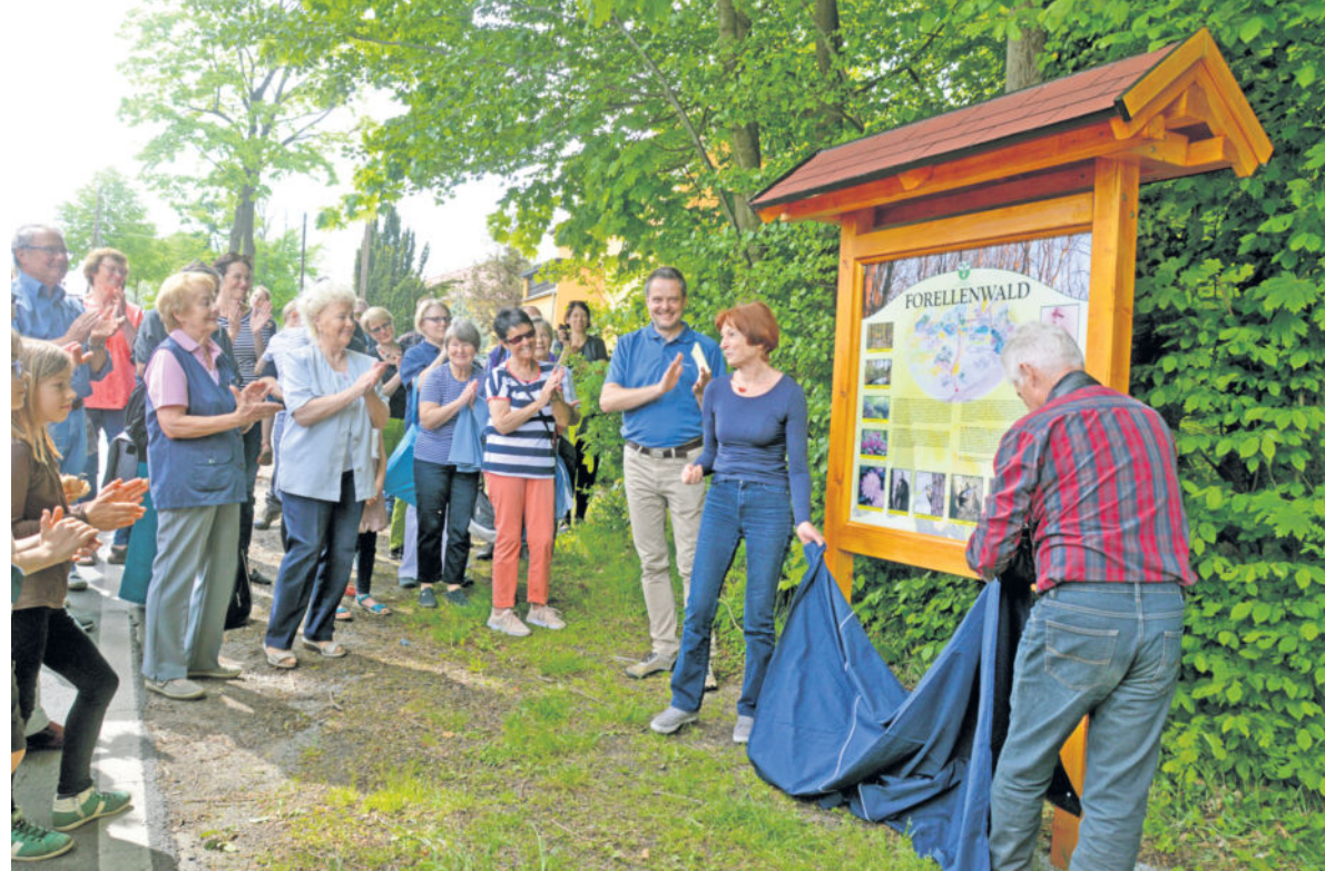
Die informative Tafel am Eingang des Wäldchens berichtet über die Geschichte sowie einzigartige Flora und Fauna, welche sich mitten im Ort Liegau-Augustusbad befindet.

Sein Grundstücksnachbar hatte gefordert, einige der alten Bäume aus Sicherheitsgründen zu fällen. Denn bereits 2014 ist ein Baum in den Anbau der Forellenschänke gestürzt und es wurde Klage auf Schadensersatz beim Landgericht Görlitz eingereicht. Zudem sollen 22, das Grundstück umgebende, Großbäume gefällt werden. In