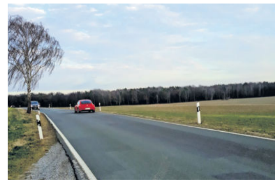
Bis ein Radweg an der Staatsstraße zwischen Liegau und Langebrück gebaut wird, dauert es vermutlich noch Jahre. Eine Alternative könnte es bis zur Realisierung nun geben.

Auf Initiative des Liegauers Raimund Pecherz wurde am 30. April erstmalig eine Liste der Öffentlichkeit übergeben, die sich für die Verbesserung der Heidewege einsetzt. Die Verlängerung der Liegauer Straße „An den Folgen“ ist nach Regenfällen unpassierbar, ebenso wenig kann man den Heideweg „Kuhschwanz“ zur Bahnunterführung Richtung Forellenteiche nutzen. Die Forderung geht dahin, die Wege ähnlich der Hauptwege der Heide instand zu setzen. Auch in Langebrück gab es vor wenigen Monaten den Vorschlag des Dörmichtweg für den Fahrradverkehr herzurichten. So könnte bis zum errichtenden öffentlichen Radweg zwischen Liegau-Augustusbad und Langebrück entlang der Staatsstraße eine Heideverbindung als Alternative funktionieren. Die Initiatoren wollen ihre Initiative in Kürze den Ortschaftsräten in Langebrück und Liegau-Augustusbad vorstellen. Über 100 Unterschriften kamen bereits zusammen. geb