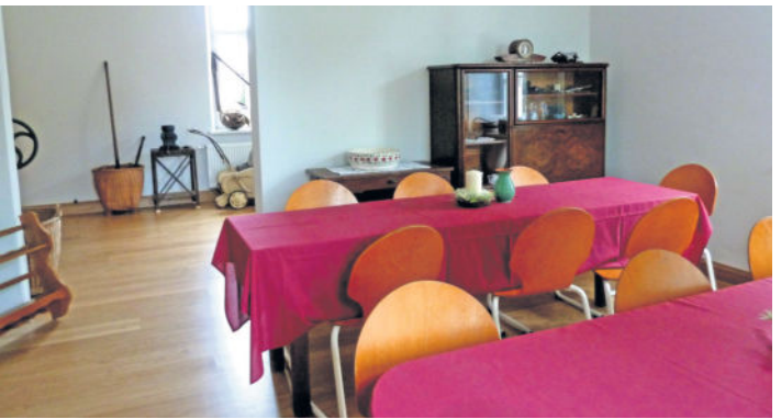
In den beiden schönen hellen Räumen kann der Heimatverein nun Gäste begrüßen und sich zusammen setzen.

Am Sonntag ist nicht nur Muttertag, sondern auch das kleine, traditionelle Heimatfest in Wachau. Genannt wird es Bankfest, da es aus einer früheren Initiative zur Schaffung der benannten Sitzmöglichkeit auf dem Dorfplatz entstand. Das Besondere in diesem Jahr ist die Eröffnung der Heimatstube im alten Gemeindeamt, welche nun am 12. Mai 2019, 14.30 Uhr feierlich begangen wird. Dazu liefen in den letzten Wochen die Vorbereitungen auf Hochtouren. Die Mitglieder des Heimatvereins steckten viel Herzblut in das Projekt, denn schon viele Jahre wartete man hier auf die Chance zur Einrichtung besagter Räumlichkeiten. Als der Jugendclub sein ehemaliges Domizil am Dorfplatz nahe dem Barockschloss verließ, bot sich die Gelegenheit. Doch das geschichtsträchtige Haus barg auch eine große Herausforderung. Nicht nur die Kosten, zahlreiche Arbeitsstunden, spät entdeckte Mängel, Verzug und Baupfusch sondern auch der Denkmalschutz ließen das Projekt, das ein oder andere Mal, fast scheitern. So hatte das Denkmalschutzamt verlangt, eine Dachgaube zu entfernen, die wohl nachträglich an das historische Gemäuer angebaut wurde. Doch die Gaube erfüllte eine wichtige Funktion, sie gewährleistete den gefahrlosen Aufstieg zum Obergeschoss. Somit ergab sich mit dem Entfernen eben ein neues Problem, die Treppe musste nicht nur neu, sondern auch gänzlich anders integriert werden. War man erst einmal unter dem Dach des ehemaligen Gemeinde-