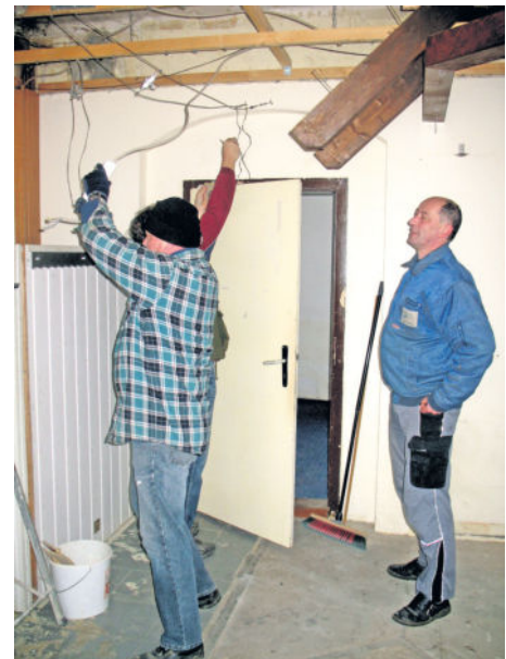
Alle packen fleißig mit an. Was der Heimatverein nicht in Eigenleistung schafft, wird durch Baufirmen erledigt. Der Gemeinderat gab dafür die benötigten Gelder in den letzten Jahren frei.

Text & Fotos: Red.; Fotos Bau: Heimatverein Wachau