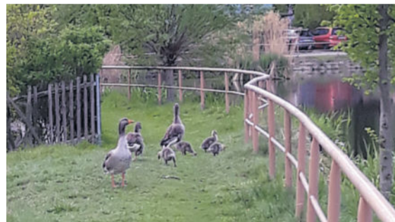
Die neuen Bewohner.