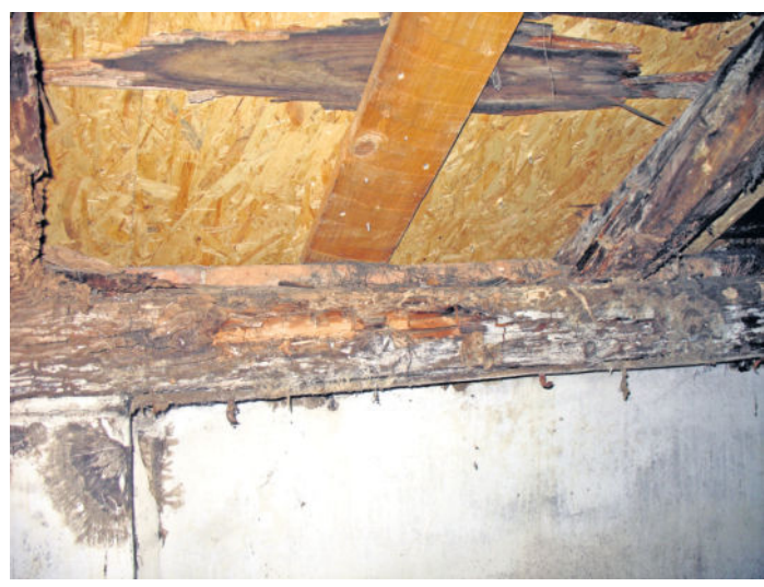
Im Dachstuhl entdeckte man Anfang 2014 erhebliche Mängel, die behoben werden mussten.

Vor rund 7 Jahren begann man an dem Projekt Heimatstube zu arbeiten. Zu den ersten Arbeiten gehörte das Entkernen und rausreißen des Fußbodens.