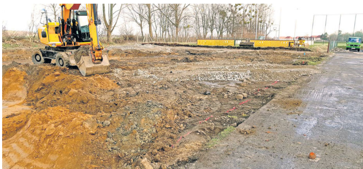
Am 25. März 2019 fiel offiziell der Startschuss für das Projekt „Ersatzneubau Turnhalle Arnsdorf“

werden Lagerplätze geschaffen, Baucontainer, WC und ein Kran aufgestellt. Außerdem fand bereits die Submission für die Wärmedämmfassade, die Dachabdichtung und das Gewerk Heizung / Lüftung / Sanitär statt. Die Angebote werden nun geprüft und dem Gemeinderat wird je Gewerk ein Vergabevorschlag vorgelegt. Die Vergabe selbst könnte dann am 17. April 2019 erfolgen. Bereits am 02. April 2019 wurde im technischen Ausschuss über die Vergabe der Gerüstarbeiten beraten und beschlossen.