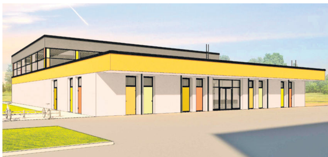
Die moderne Einfeld-Sporthalle kostet rund 3 Millionen Euro und wird durch ein Förderprogramm mitfinanziert.

Infolge dessen trugen die Bauleute den Oberboden des Areals ab und lagerten ihn im nahen Gewerbegebiet ab. In den letzten Wochen folgte die Baustelleneinrichtung mit dem Anschluss von Bauwasser und den dazugehörigen Abwasserleitungen. Um die Baustelle zu komplettieren,