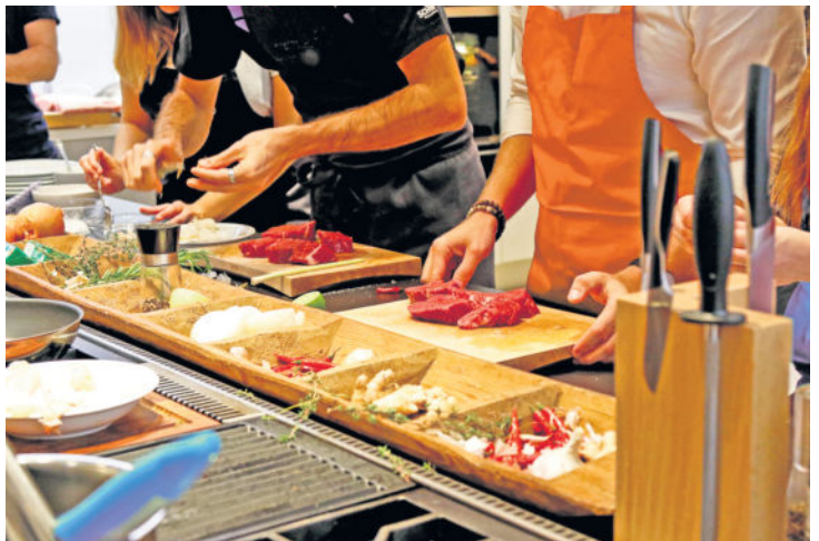
Paleo, auch bekannt als Steinzeit-Ernährung, findet zunehmend Anhänger. In einem Kochkurs kann man Grundlagen, Rezepte und Tipps kennenlernen.

(djd). Der Winter ist lang und kalt genug. Doch wenn die ersten Sonnenstrahlen motivieren und ins Freie locken, ist der Körper meist noch träge. Um dem vorzubeugen, wollen viele etwas dagegen unternehmen: Ein individuelles Detox-Programm passt sehr gut in diese Jahreszeit, um den Körper von bedenklichen Stoffen zu befreien und frische Energie zu tanken. Wichtig sind dabei vor allem zwei Aspekte: eine gesunde, ausgewogene Ernährung und viel Bewegung. Für neue Anregungen und Ideen sorgen Erlebnisse, die man sich selbst oder auch anderen als persönliches Achtsamkeitsprogramm schenken kann.