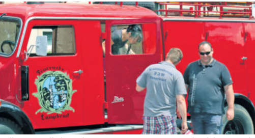
Selbstverständlich wird es am 1. Juni zum Feuerwehrjubiläum wieder Rundfahrten mit dem historischen Fahrzeug geben.

Zweiter Verein im Feierreigen ist der Keramikzirkel, den es seit 60 Jahren in Langebrück gibt. Die 29 Mitglieder wollen ihre Werke vom 14. bis 15. September im Bürgerhaus mit einer abwechslungsreichen Festveranstaltung präsentieren. Zudem will der Verein eine Chronik schreiben. Ein Highlight ist eine Wanderung, die unter anderem zum DRK-Seniorenheim „Albert Schweitzer“ führt, dessen Garten der Keramikzirkel mit verschiedenen Arbeiten verschönert hat.