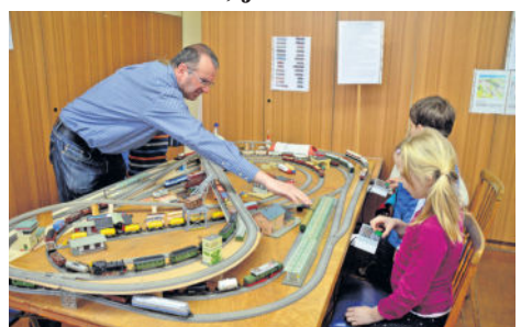
Im letzten Jahr kamen zahlreiche Besucher, um sich die Arbeiten der Modellbahner anzuschauen. Vor allem die kleinen Gäste hatten am Selbstfahren ihren Spaß.

Am letzten Wochenende der Winterferien 2019 laden wir Sie wieder recht herzlich zu unserer Ausstellung und den Selbstfahrttagen ein. Es besteht die Möglichkeit, Züge selbst auf unserer digitalen H0-Vereinsanlage zu steuern. Auch das Mitbringen eigener Modelle (digitalisiert oder digitalisierbar mit Steckdecoder) ist möglich. Natürlich sind auch alle anderen Modellbahn-Begeisterten zum Betrachten der Anlage, Beobachten des Zugverkehrs und Erkennen von Situationen anno 1985 sowie Fragen zum Modellbahnbau oder auch Diskutieren sehr herzlich willkommen. Wir freuen uns auf Ihren Besuch!