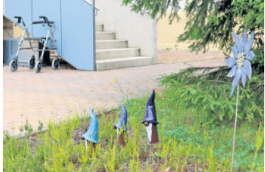
Im vergangenen Jahr sponserte der Keramikzirkel diese Kunst für den Garten des Seniorenheims. Diese und weitere Werke sollen im September im Rahmen einer Wanderung zum 60-jährigen Jubiläum näher erklärt werden.