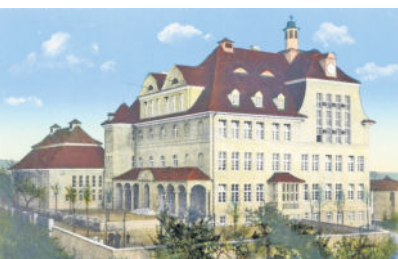
Die 1912 fertiggestellte Neue Realschule auf dem Freudenberg.

Otto Bauer initiierte ebenfalls den Bau des „Königlichen Feuerwerkslaboratoriums Radeberg“ (später Sachsenwerk / Rafena / Robotron), indem der Stadtrat das Gelände des ehemaligen Artillerie-Übungsplatzes, unmittelbar südlich der Bahnstrecke Görlitz-Dresden, einschließlich zugekaufter Grundstücke, im Mai 1915 der Feldzeugmeisterei Dresden zum Kauf durch die Reichsfinanzverwaltung anbot, um dort die neue Fabrik errichten zu können. Der inzwischen gleichzeitig weit fortgeschrittene Straßenauf- und der zugesicherte direkte Eisenbahnanchluss in das geplante werkeigene Bahn-Netz, forcierten schließlich den Bau dieses Großbetriebes, in dem außer bis zu 1.500 Bauarbeiter später zeitweise bis zu 5.000 Menschen beschäftigt waren. Als Folge dieses Baues entwickelte sich auch der städtische Wohnungsbau. Dabei wurde auch die neue Form des genossenschaftlichen Wohnungsbaus im Süden Radebergs, unter maßgeblicher Regie des Stadtrates Ernst Braune, zum Grundstein für