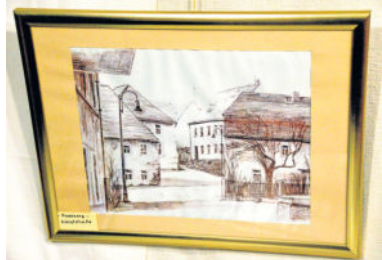
Auch in Radeberg fand der Hobbykünstler schon historisch-anmutende Motive, wie hier die Schlossstraße.

Anfragen bekommt der ehemalige Chemigraf und Glasmaler in letzter Zeit häufig. „Of besuchen mich interessierte Leute. Zuletzt bekam ich Ausstellungsanfragen aus Großkammansdorf und Radeberg. Letztere luden mich ein, zum Stadtjubiläum Radeberg800 in