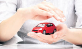
txn-p. Die Kfz-Versicherung sollte zu den eigenen Bedürfnissen und Lebensumständen passen. Daher empfehlen sich flexible Tarife nach dem Baukastenprinzip.

setzlich vorgeschrieben. Sie stellt sicher, dass Geschädigte im Straßenverkehr garantiert finanzielle Leistungen erhalten und kommt für Sach-, Personen- und Vermögensschäden auf. • Für Schäden durch Diebstahl, Glasbruch, Brand und Explosion sowie Kollision mit Tieren (einige Versicherer grenzen dies auf Haarwild ein) kommt