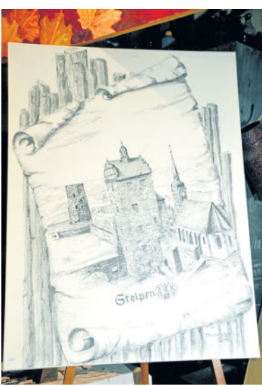
Historische Bildnisse, wie dieses Exemplar der Burg Stolpen, könnten auch noch für Radeberg entstehen.

entsteht durch die Art des Zimmers, welches ein alter Heuboden oder Schuppen, eben ein altes Gemäuer ist. Zur Zeichnung kommt das Positionieren alter Geräte und Utensilien, die vom Arbeitsblatt ausgeschnitten in die individuellen Bleistiftzeichnungen eingeklebt werden. Der Blick auf das Detail macht Geschichte erlebbar. Die langjährige Lehrerin zeigt