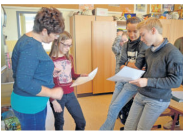
Im Gespräch mit den Schülerinnen und Schülern: Nützliche Ratschläge für die perspektivischen Arbeiten.

Beispiele großer Künstler, die mit viel Geduld und Muse ganze Räume mit unzähligen Gegenständen ausgestattet haben. Und auch in Schwarz / Weiß kann eine einfache Bleistiftzeichnung Szenen zum Leben erwecken. Schat-