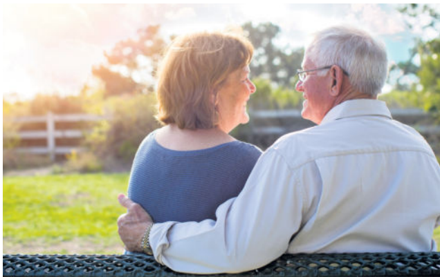
txn. Fit, gesund und gut versorgt den Lebensabend zu genießen – das wünschen sich die meisten. Deshalb lohnt sich die private Vorsorge.

txn. Ein schönes Zuhause, regelmäßig mit Freunden und der Familie essen gehen und ab und an in den Urlaub fahren? Gesund, aktiv und finanziell selbstbestimmt – so stellen sich die meisten Menschen ihren Lebensabend vor. Fakt aber ist: Jeder Zehnte im Alter zwischen 75 und 80 Jahren und jeder Fünfte zwischen 80 und 85 Jahren ist heute pflegebedürftig – und der Anteil der Pflegebedürftigen an der Gesamtbevölkerung steigt. Die Leistungen der gesetzlichen Pflegeversicherung decken im Ernstfall nur einen Teil der entstehenden Kosten. Wer weniger als 45 Jahre angestellt gearbeitet hat, muss heute häufig mit 900 bis 1.000 Euro Rente