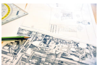
Anhand von Beispielen der „Profis“ können sich die Kids eigene Ideen kreieren und Techniken abschauen.

Nicht unbedingt in Verbindung mit dem Rosso-Majores-Preis aber zumindest perspektivische Kunst in Verbindung