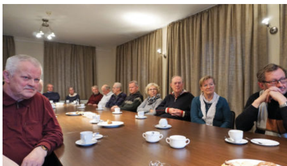
Groß war wieder das Interesse, das Café im Bürgerhaus war bis auf den letzten Platz besetzt.

Stelle der jetzigen Halle errichtet werden. Positive Nachrichten auch in Hinblick auf die Zugstrecke seitens der Deutschen Bahn, denn die Elektrifizierung zwischen Dresden und Görlitz ist angesagt. Wann das Projekt realisiert wird, ist derzeit noch vollkommen offen. Laut Unternehmen werden mindestens zehn Jahre ins Land ziehen, vor 2029 wird kaum etwas passieren, zumal offenbar noch nicht einmal die Finanzierung geklärt ist. Spätestens im Jahr 2023 wird die Langebrücker Feuerwehr ein auf zukünftige Anforderungen gerichtetes Gerätehaus haben. Die Naherholungsfunktion des Ortes erfährt mit der Ausschreibung des früheren Postgeländes am Waldbad eine zukunftsweisende Richtung. Kritisch, aber zugleich auch optimistisch setzte sich Christian Hartmann zum Schluss seines Eingangsstamens mit der Langebrücker Vereinsstruktur auseinander. Ihn treibt die Frage um „Wer will ehrenamtliche Verantwortung übernehmen?“ Dass Vereine Nachwuchs Sorgen haben, ist nicht nur ein Langebrücker Problem. Für ihn gilt die Frage zum Ehrenamt im erweiterten Sinn. Wie werden wir