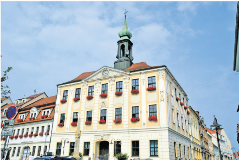
In der letzten Stadtratssitzung 2018 wurde der neue Doppelhaushalt beschlossen.

Das ist der Finanzplan 2019/2020 der Stadt Radeberg