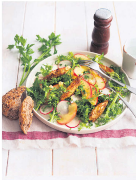
txn. Einfach köstlich, der Frisée-Salat mit gebratenen Putenstreifen, Apfelscheiben und Radieschen, abgeschmeckt mit einem Hauch von Curry.

Weitere ausgefallene Rezeptideen unter www.landgenuss-magazin.de