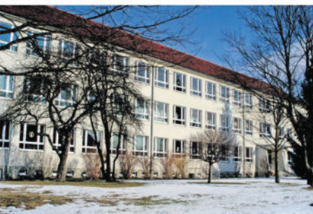
Die Komplettanierung der Grundschule Süd ist eines der Großprojekte für 2019/2020.

eher soll die Überdachung des Außenbereichs des Speiseraumes umgesetzt werden sowie die Innenverdarkung der Aula. Etwas weiter in der Zukunft liegt der Neubau eines Sportplatzes, der für 2023 mit 100.000 Euro schon einmal wage in die Planung geht.