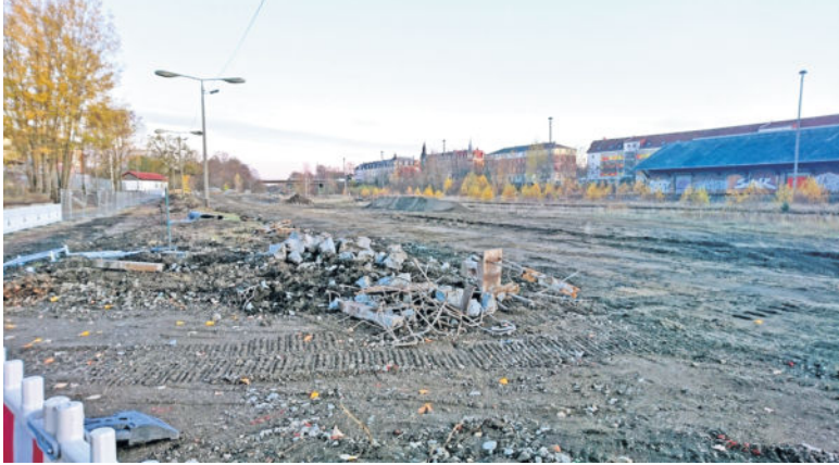
Das Pflaster wurde bereits komplett entfernt und das Baufeld freigemacht. Im Mai 2019 soll die Erweiterung fertig sein.

Band-Schnitt am 14. Juni 2006, der langersehnte Park & Ride Platz wurde durch Oberbürgermeister Gerhard Lemm, Vertreter der Stadt Radeberg sowie dem VVO freigegeben. Zu dieser Zeit ist der Bahnhof Radeberg in aller Munde. Große Sanierungsarbeiten verhelfen dem historischen Gebäude sowie dem dazugehörigen Areal zu neuem Glanz. Zwar wird der Radeberger Bahnhof nicht mehr wie in früheren Zeiten vom Güterverkehr bestimmt, allerdings ist er mittlerweile zu einem wichtigen Knotenpunkt des öffentlichen Personennahverkehrs geworden. Die dazugehörige Park & Ride Anlage bot den Pendlern seither rund 100 Parkplätze, welche auch 4 Behindertenparkflächen beinhalten. 50 überdachte Fahrrad- und Kradstellplätze bieten ebenfalls einen bequemen Umstieg in die öffentlichen Verkehrsmittel, denn auch der große, übersichtliche Busbahnhof sorgt für zusätzlichen Kundenstrom. So groß die Freude über die zahlreichen Parkplätze damals war, merkte man doch im Laufe der nachfolgenden Jahre, dass diese leider nicht für alle Fahrgäste reichte. Gerade zu den Stoßzeiten findet nicht jeder Pendler einen Parkplatz und muss sich anderweitig eine Stellfläche suchen. Ein bekanntes Areal für ein zusätzliches Angebot bietet