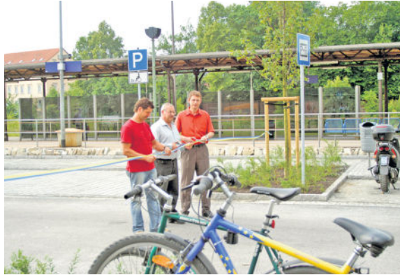
Mitte Juni 2006 wurde der verkehrsstarke Knotenpunkt durch die Park&Ride Anlage erweitert, welche durch OB Lemm und weitere Vertreter von Stadt und VVO eröffnet wurde.

sich allerdings für eine Erweiterung an. Die ehemalige Ladestraße diente den Fußgängern als kurze Verbindung in Richtung Rathenaustraße, wurde aber ansonsten wenig genutzt. Letztendlich konnte die Stadt eine Eigentumsübertragung von der DB AG bewirken und so sind nun die Bauleute am Zug. Laut Entwurfsplanung entstehen mit dieser Maßnahme 106 weitere Stellplätze, Behindertenparkplätze und Elektroladesäulen. Fördermittel vom Verkehrsverbund Oberelbe und vom Freistaat Sachsen konnten die Verwaltungsmitarbeiter bereits verbuchen. Bis Mai 2019 sollen die Arbeiten abgeschlossen sein, dann wird es wohl wieder einen Band-Schnitt geben.