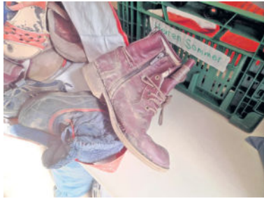
Leider werden auch schmutzige, kaputte Sachen einfach vor der Tür der Kleiderkammer abgelegt. Spenden werden allerdings nur während der Öffnungszeiten und in vertretbarem Zustand angenommen.

Spendenkonto: DKD Bank IBAN: DE92 3506 0190 1800 1060 16 BIC: GENODED1DKD