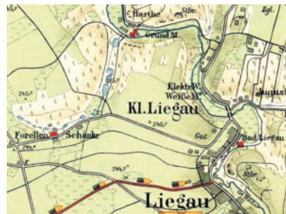
Ausschnitt aus der „Meinhold-Karte“ 1916. Das Herrmannsbad (rechts) und die Kaskade von Forellen-Teichen (Grundmühlenschänke, links) um den „Forellen-Wald“ sowie die „Harthe“ nördlich der Grundmühle sind deutlich sichtbar.

der Anlass für den Bau des „Herrmannsbades“, mit einem Badehaus hinter dem Rittergut, unmittelbar an der Röder, das 1857 eröffnet wurde. Das heilkräftige Wasser wurde von der Quellwiese in großen grünen Holzfässern auf Pferdefuhrwerken zum Badehaus am Rittergut gefahren und in die Bottiche und großen Wannen abgefüllt. In den folgenden Jahren kam es durch die stetig steigenden Gästezahlen zu umfassenden Erweiterungen und Verbesserungen der Kuranlage, Gebäude zur Unterbringung der Badegäste wurden errichtet und Parkanlagen geschaffen. Das harte mineralhaltige Quellwasser wurde mit weichem Röderwasser für Kuren vermischt, woran man erkennen kann, welche gute Wasserqualität der Röderfluss damals besaß. Die Leitung des Bades unterstand dem Radeberger Badearzt Dr. med. Böhme. Das Stahl- und Moorbad Herrmannbad gehörte von 1857-1914 zum Rittergut und erfreute sich mit seiner Lage, eingebettet in die herrliche grüne und romantische Umgebung des Rödertales, zunehmender Beliebtheit. Für den Aufenthalt der Kur- und Badegäste entstanden in dieser Zeit auch die vielen Landhäuser und Villen in Liegau, zumeist in herrlichster Hanglage.