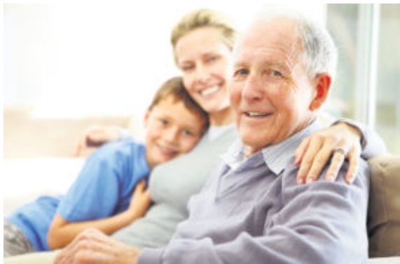
Ältere Angehörige, die nicht genügend Nährstoffe aufnehmen, können durch Trinknahrung aus der Apotheke eine Lösung finden.

Wenn ältere Angehörige keinen Appetit mehr haben