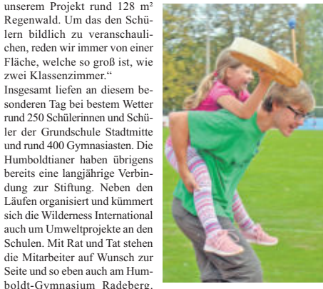
Eine Runde geschenkt bekam diese Grundschülerin, welche am Aktionstag Geburtstag feierte. Huckepack und mit Trommel ausgestattet, feierte sie ihre Mitstreiter aus luftiger Höhe an.