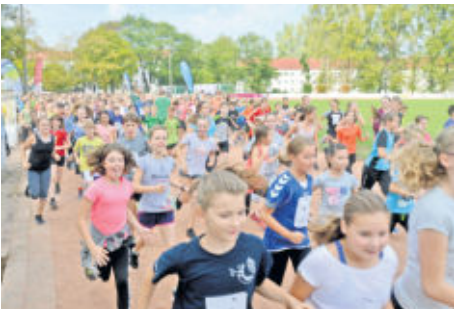
Massenstart bei den Gymnasiasten. Rund 400 Schüler aus 13 Klassen liefen für den Regenwald.