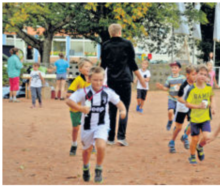
Abklatschen nach absolvierter Runde – Motivation muss sein.

Pünktlich 09.00 Uhr, am Mittwoch, dem 19.09.2018, starteten die Schüler der Grundschule Stadtmitteln ihren Wildnislauf im Vorwärtsstadion auf der Schillerstraße in Radeberg. Und vorwärts ging es dann im wahrsten Sinne des Wortes eine ganze Stunde. Pro gelaufene Runde konnten sich die Mädchen und Jungen über ihre im Vorfeld gewonnenen Sponsoren Geld sichern. Geld welches das Überleben des westkanadischen Regenwaldes sichert. Mit dieser Aktion der Stiftung Wilderness International können schon die Jüngsten ihren ökologischen Fußabdruck hinterlassen. Und dafür kämpfen sich die motivierten Grundschüler Runde für Runde voran. So mancher schaffte mit die 20 Stadionrunden, die immerhin je 400 Meter lang sind. Ganz stolz und erschöpft kamen die kleinen Läufer dann im Ziel an.