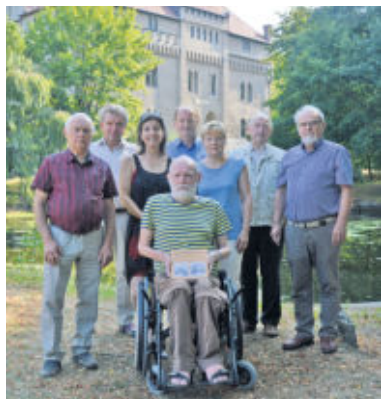
Die ehrenamtlichen Chronikautoren präsentieren ihr fertiges Werk und können mit Recht stolz auf das Geschaffene sein.