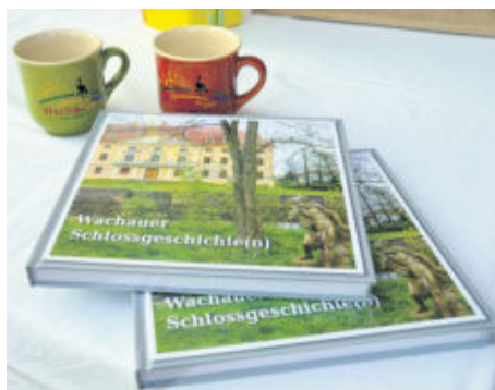
Am Freitagabend wurde auch das Buch Wachauer Schlossgeschichte(n) vorgestellt. Ein Buch mit Schlossgeschichte und Schlossgeschichten, welches die Chronikgruppe Wachau mit viel Mühe zusammen gestellt hat. Zudem konnten sich die Gäste eine hübsche Tasse zur Erinnerung an das große Festjubiläum kaufen. Diese handgefertigte Keramik wurde liebevoll in limitierter Auflage gestaltet.