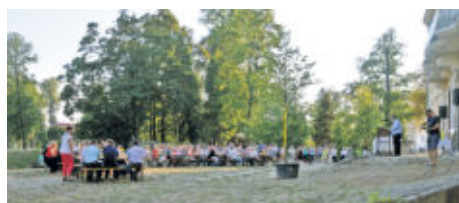
Zahlreiche Gäste kamen zur Eröffnung der Jubiläumsfeier, nebst Parkeröffnung und Chronikübergabe des Schlosses. Ein großes Geschenk stach sofort ins Auge – die Winterlinde von der Firma Müllermilch.