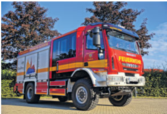
Das neue Löschruppenfahrzeug ist am 26.07.2018 in Radeberg angekommen. Der Vorgänger des neuen LF20 wurde Ende 2015 bei einem Verkehrsunfall so stark beschädigt, dass es außer Dienst gestellt werden musste.

Für Klein und Groß ist es doch immer wieder ein Erlebnis, die Feuerwehr mal hautnah entdecken zu können. So bietet auch die Freiwillige Feuerwehr Radeberg Einblicke in ihren Alltag. Retten – Löschen – Bergen lautet das Motto und was sich dahinter verbirgt und welche Kenntnisse die Kameradinnen und Kameraden sich aneignen müssen, wird im und am Gerätehaus zu sehen sein. Natürlich können auch die Fahrzeuge besichtigt werden. Im Fokus steht hier natürlich ganz klar das neue Löschruppenfahrzeug, welches am 26.07.2018 durch die Radeberger Wehr übernommen wurde. Der Iveco IG150EW2CA mit dem Aufbau Magirus ist quasi nagelneu und dient zur Brandbekämpfung und für einfache technische Hilfeleistung. Bis zu neun Einsatzkräfte haben in dem 3,30 Meter hohen Fahrzeug Platz. Auf 8,60 Meter Länge versteckt sich eine Menge Leistung. So umfasst der Wassertank 2.000 Liter, die mit einer Pumpleistung von 10 bar binnen einer Minute ausgeworfen werden können. Damit das Fahrzeug schnellstmöglich zum