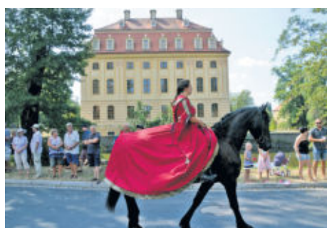
Barockreiten wurde nicht nur am Samstag vor dem Schloss präsentiert, sondern auch zum Umzug.