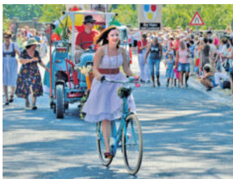
Etlliche Zeitepochen und Modetrends zogen sich im Festumzug abwechslungsreich durch den Ort.