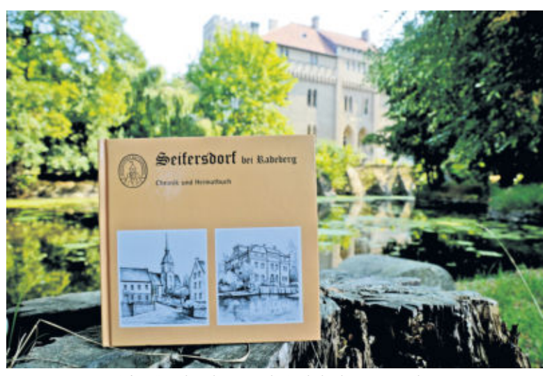
Auf 444 Seiten kann der Leser in die Geschichte des Ortes eintauchen.

findet der Leser immer genau das, was ihn interessiert. So sind für alteingesessene Seifersdorfer sicherlich die zahlreichen Fotos und Erzählungen aus Kindertagen oder die Aufnahmen des so wichtigen landwirtschaftlichen Geschehens von großem Interesse. Das umfangreiche Literatur- und Quellenverzeichnis verweist nicht nur auf die Herkunft des zusammengetragenen Materials, sondern zeigt auch das große Interesse an diesem Werk.