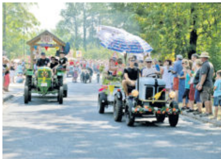
Fast schon ein kleines Traktorrennen – die Vereine haben sich alle Mühe bei der Gestaltung der Umzugswagen gegeben.