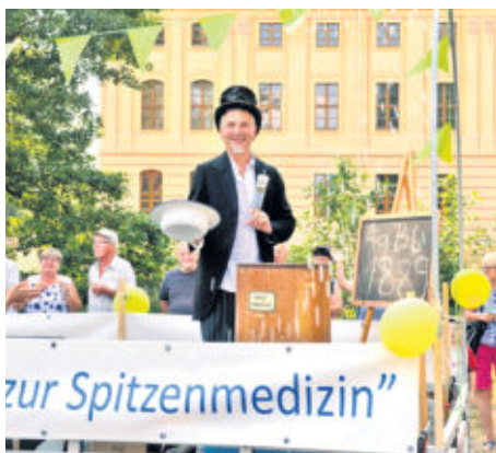
Eine Abkühlung versorgte unter anderen der Umzugswagen des Epilepsiezentrum Kleinwachau.