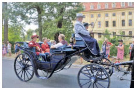
In historischem Gewand fährt die Kutsche die „Obrigkeiten“ des Dorfes zum Festumzug.