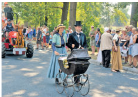
Familie und Tradition stehen im Fokus.