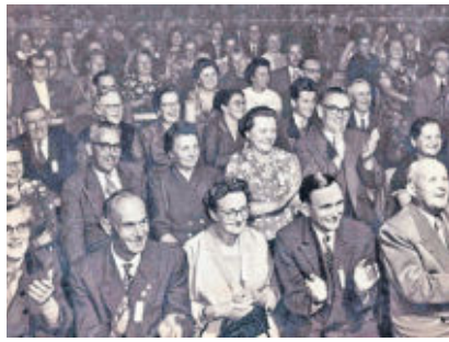
„Lotzdorf lacht“.

Teil 1 - Das gehörte über Jahrhunderte zu Lotzdorf: feste, feste seine Feste zu feiern, und das zeichnete dieses Dorf auch schon immer aus. Lotzdorf war eine kleine Dorfgemeinschaft, die es „in sich hatte“, die immer wieder verstand, trotz aller auch hier auftretender „menschelnder“ kleinerer oder größerer Unstimmigkeiten, durch die gemeinsame Organisation von Höhepunkten ihre Gemeinschaft