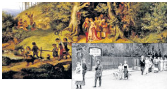
„Brautzug im Frühling“ - Ludwig Richters Original (Ausschnitt) und die originalgetreue Nachbildung im Lotzdorfer Festzug 1954

1954 Große Feierlichkeiten anlässlich des 70-jährigen Bestehens der Schule, die zur Ludwig-Richter-Schule umbenannt worden war. Als Koordinator zeichneten für das vierstägig geplante Fest Schuldirektor Hoyer verantwortlich. Der historische Festzug stellte Bilder Ludwig Richters nach, u.a. das Gemälde „Brautzug im Frühling“.