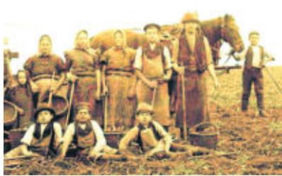
Kinder als Ernte-Arbeiter, um 1900