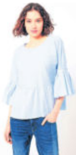
An einer Bluse in Streifenmuster wie hier aus der aktuellen Talkabout-Kollektion kommt in dieser Saison niemand vorbei.

optisch strecken. Ein modisches Oversize-Oberteil mit Querstreifen lässt sich gut mit einer schmal geschnittenen Hose kombinieren.