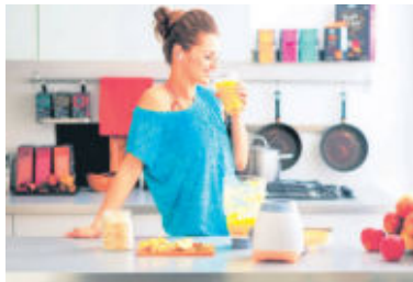
Jetzt gezielt auf eine gesunde Ernährung, entschlackende Smoothies und viel Bewegung setzen - das macht schön und fit für die warme Jahreszeit.

(djd). Nach Monaten der Kälte und der trockenen Heizungsluft blickt uns aus dem Spiegel oft ein fahles Gesicht entgegen. Der Teint wirkt matt, blass und müde. Höchste Zeit für ein paar Schönheitswochen, um der Haut den frühlingsfrischen Glow zu geben. Im ersten Schritt gilt es, den Grauschleier loszuwerden. Die beste äußere Maßnahme dafür ist ein Peeling, das man bequem zuhause machen kann. Dabei sind Enzympeelings meist sanfter als Rubbelpeelings, die kleine Schleifkörper enthalten. Noch effektiver sind professionelle Behandlungen wie beispielsweise die Mikrodermabrasion, bei der mit präzisen Diamantschleifköpfen die oberste Hautschicht von Verhornungen und abgestorbenen Schüppchen befreit wird.