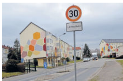
Die marode Pflasterpiste soll saniert werden. Für die Anwohner der viel befahrenen Heidestraße würde das eine Lärmreduzierung bedeuten.