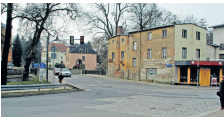
Ein Flickenteppich nebst irreführender Straßenführung - nun soll die Kreuzung bald saniert werden.

Im vergangenen Jahr wurde ein Mammutprojekt in die Tat umgesetzt. Mit der Ober- & Badstraße wurde eine wichtige Verkehrsader in Radeberg grundhaft saniert und die Straßenführung angepasst. Das befürchtete Chaos durch die Öffnung der Einbahnstraße bis zum Parkplatz blieb aus. Nun rollt der Verkehr wieder ungestört durch Radeberg. Hatte es doch besonders in den Sommermonaten harte Kritik gehandelt, da durch zahlreiche weitere Sperrungen im Umland täglich Stau in der großen Kreisstadt herrschte. Die Akte Oberstraße / Badstraße konnte das Bauamt in Radeberg nun erfolgreich schließen.