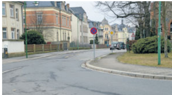
Die Dr.-Rudolf-Friedrichs-Straße ist einer der schlimmsten Holperpisten Radebergs.