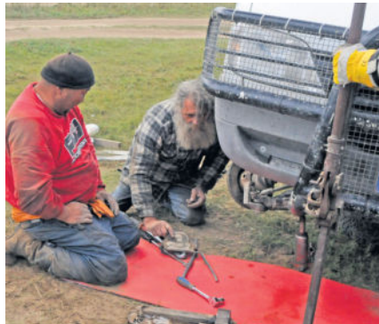
Da gibts ein Problem, kompletter Federbruch an der Vorderachse in den mongolischen Weiten.