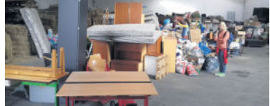
Die Hilfsgüter vor Ort in einer Halle in dem kleinen portugiesischen Dorf Vale do Gueiro