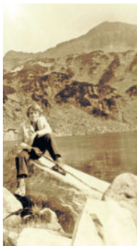
vor dem Vichren 1973

Als Abenteuerer war ich oft wochen-, monate- und sogar jahrelang abseits unterwegs. Diese Neugier auf Unbekanntes und Neues trieb mich schon als Kind in die Wildnis. Das kleine Dörfchen Alzella bei Nossen, wo ich meine Kindheit verbrachte, war dabei für mich ein riesiger Abenteuerspielplatz rund um die Haustür, denn gleich am Dorfrand begann der Wald und zog sich mit dem Zellwald bis kurz vor Freiberg. Nach der Schule und erst recht in den Ferien schnappte ich mir meinen selbst gebauten Pfeil und Bogen, holte meinen Hund aus dem Zwinger und war, nicht immer zur Freude meiner Eltern, den gesamten Tag in den Wäldern verschwunden. Auf diesen Streifzügen wurde einfach alles erkundet, ob alte Bergbaustollen, Steinbrüche, Bäche, Teiche oder sich an Tiere anschleichen und diese stundenlang beobachten oder Pflanzen sammeln. Egal zu welcher Jahreszeit oder welches Wetter gerade war, es gab immer und überall etwas zu erleben.