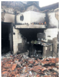
So sehen die zerstörten Häuser im Dorf aus

Feuerwalze überrascht wurden. Bei diesem Flächenbrand verloren sie ihr mobiles Zuhause und ihr ganzes Hab und Gut. Sie konnten gerade noch die wichtigsten Papiere und ihre 3 Kinder schnappen und vor dem Feuer flüchten. Sie selbst sind zum Glück wohl auf. Aber nicht nur ihnen ging es so. Viele Menschen verloren ihr Leben, wurden verletzt oder verloren ihr Zuhause und stehen praktisch vor dem Nichts. Mit einem Aufruf für Sach-