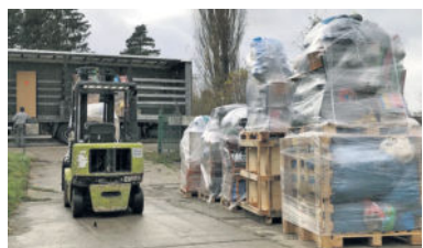
Beladung des Sattelzuges mit Hilfsgütern in Radeberg

und Geldspenden organisierte der Radeberger Verein in kürzester Zeit einen Hilfstransport. Den Sattelzug beluden die Vereinsmitglieder palettengerecht mit Hilfsgütern und dann fuhr er in rund 4 Tagen nach Portugal.