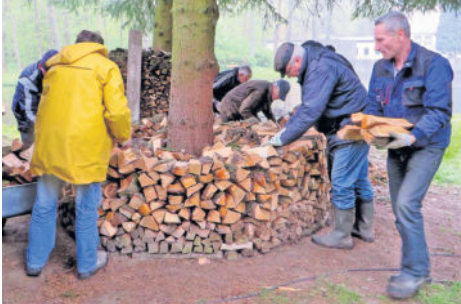
Verwertbares Bruchholz und Treibgut wurde kleingehackt und in Nähe vom Bockfen gestapelt. Wer das Klassenzimmer im Grünen und den Bockfen nutzen will sollte sich beim Hüttertal-Verein anmelden.

Sehr ärgerlich und missachtend der ehrenamtlichen und gemeinnützigen Tätigkeit der Akteure, wurde das Schild „Zum Tornadomann“ und benachbarte Bänke durch Vandalismus beschädigt und zerstört. Ausgeleert und verstreuter Inhalt der Müllkübel ist nicht unbedingt Wanderern zuzuschreiben; es übernehmen immer mehr Waschbären das Ausräumen dieser Kübel. Unsere Aufforderung an die Wanderer: nehmt Euren Müll wieder mit!