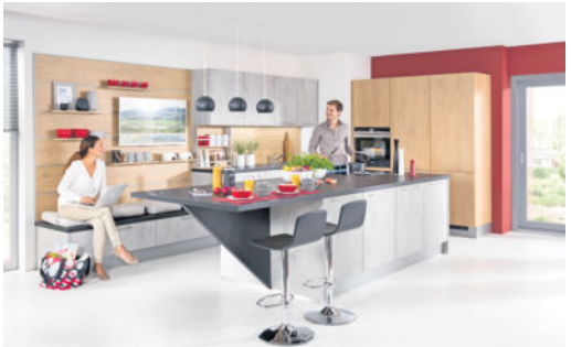
Die moderne Küche ist geprägt durch eine offene Raumgestaltung, in der die Bereiche des Wohnens, Essens und Kochens immer mehr miteinander verschmelzen.

Trendlooks für Ihr Zuhause Farblich tendiert man 2017 weiterhin zu Pastell- und Retrofarben. Colour Blocking ist angesagt, beispielsweise mit einem Mocca-Braun und einem Petrol-Blau. Für mutige Trendsetter gelten die Mustermixe vom amerikanischen Designer Jonathan Adler als Stilvorlagen. Natur pur symbolisiert die Tendenz zum ökologischen Umgang mit Ressourcen. Hochwertige und langlebige Holzmöbel in den Lieblingshölzern Eiche, Buche und Nuss verlassen vermehrt die Möbelgeschäfte. Dabei darf es ruhig ein Mix aus Holz und Metall sein. Man bleibt dem skandinavischen Look treu, was wohl auch an der Verbreitung eines großen, schwedischen Möbelhauses liegt. Schwarzes Metall und ein robuster Korpus aus Holz gelten als zeitlose, puristische und moderne Möbelstücke. Tischplatten sind immer häufiger aus Materialien wie Granit, Stein und Beton gefertigt und werden somit zum echten Hingucker in Sachen Stilbruch. Außerdem stehen die Möbelstücke 2017 bodennah oder auf Kufen, damit schafft man sich eine trendige Raumkultur. Perfekt ausgeleuchtet werden Wohnzimmer, Küche und Co. nun noch mit Pendelleuchten, am besten gleich mehrere nebeneinander.