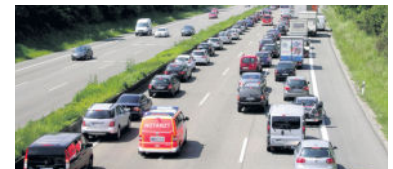
Die Rettungsgasse muss bereits bei stockendem Verkehr gebildet werden.

Schon beim ersten Anzeichen eines Staus bzw. bei stockendem Verkehr sollte man sein Führverhalten anpassen, ausreichend Abstand zum Vordermann halten und wachsam bleiben. Stehen die Fahrzeuge dicht an dicht, ist ein Ausweichen meist nicht mehr möglich. Auf Autobahnen und auf Straßen mit mehreren Fahrstreifen je Richtung hält man sich im Ernstfall auf der linken Spur so weit wie möglich am linken Rand. Alle die sich auf der mittleren und rechten Spur befinden weichen nach rechts aus. Auf zweispurigen Strecken gilt das gleiche Prinzip. So können die Rettungskräfte zügig durchfahren und mit den Bergungsarbeiten beginnen. Übrigens, wer denkt Polizei, Feuerwehr und Co. können doch auch den Standstreifen benutzen, der irrt. Nicht alle Standspuren sind überall durchgehend ausgebaut und breit genug. Außerdem könnten sich dort auch Pannenfahrzeuge befinden. Verhalten Sie sich vorschriftsmäßig und machen den Weg frei, damit haben Sie auch eine Vorbildfunktion für andere Autofahrer. Wenn sich der Stau auflöst, darf man zurück auf die Fahrspur. Erst dann ist si-