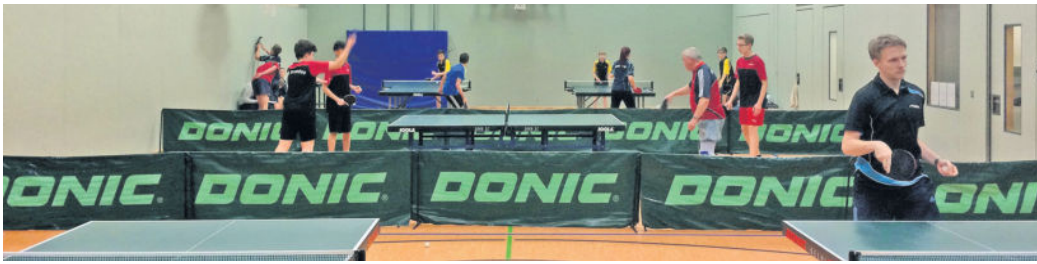
Punktspielbetrieb in der Turnhalle der Ludwig-Richter-Oberschule in Radeberg-Lotzdorf