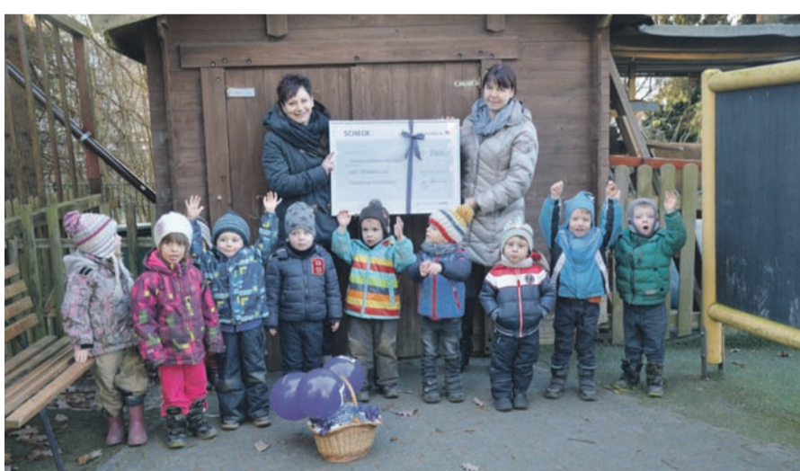
Auch einen Korb mit Geschenken gab es vom Unternehmen, welches 2.900 Euro an das Radeberger Kinderland spendete.