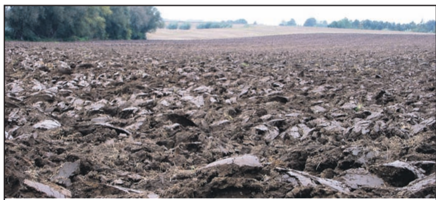
Bauernstolz - Frischer Acker bei Lotzdorf

Das kleine Dorf Lotzdorf, einst vor der Eingemeindung nach Radeberg im Jahr 1920 ein eigenständiges Reihendorf, angelegt in der speziellen Form eines einstigen Waldhufendorfes, blickt auf eine lange Geschichte zurück. Diese geht weit über die gern erwähnte urkundliche Erstbesiedlung und Dorfgründung im Jahr 1341 hinaus. Das Gebiet der um 40 m ansteigenden Hangmulde zwischen der Großen Röder und der östlich angrenzenden Hochfläche war bereits zu urgeschichtlichen Zeiten ein Siedlungsort. Reste einer Siedlung aus der Bronzezeit (1800 - 700 v. Chr.) wurden westlich der Talmühle festgestellt, ebenso westlich der Tobiasmühle (Richtung Kühnheide - Hohlweg). Die Konzentration an bronzezeitlichen Funden in diesem Gebiet, mit Fundplätzen in Lotzdorf am Taubenberg nördlich des Folgenberges und auf dem Flurstück Nr.151 sind bemerkenswert. Diese Entdeckungen lassen vermuten, dass sich bronzezeitliche Wohnstätten am gesamten linken Röderufer im Bereich der Gemarkung Lotzdorf befunden haben könnten.