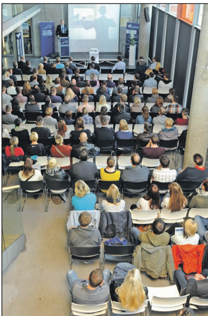
Die Hochschulzugangsprüfung berechtigt dazu, ein akademisches Fernstudium in den Bereichen BWL, Wirtschaftsinformatik, Wirtschaftsrecht sowie Gesundheits-, Sozial- oder Sportmanagement aufzunehmen.

Die Möglichkeiten, ohne Abitur oder Fachhochschulreife ein Studium aufzunehmen, variieren je nach Bundesland und Hochschule. Bei WINGS, einem der führenden Fernstudienanbieter Deutschlands, können Berufserfahrene eine Hochschulzugangsprüfung (HZP) ablegen, die dazu berechtigt, ein akademisches Fernstudium in den Bereichen BWL, Wirtschaftsinformatik, Wirtschaftsrecht sowie Gesundheits-, Sozial- oder Sportmanagement aufzunehmen. Berufstätige sparen mit der eintägigen HZP - die sich in einen schriftlichen und kurzen mündlichen Teil gliedert - bis zu drei Jahre im Vergleich zum Abitur per Abendschule. Die nächste HZP findet am 4. Juni 2016 in Wismar und Frankfurt am Main statt. Alle Informationen gibt es unter www.wings-fernstudium.de . Ein Fernstudium kann man im Übrigen unter Umständen auch ohne HZP aufnehmen: Das gilt für diejenigen, die eine Aufstiegsfortbildung der IHK zum Beispiel als Meister, Fachwirt oder Betriebswirt vorweisen können.