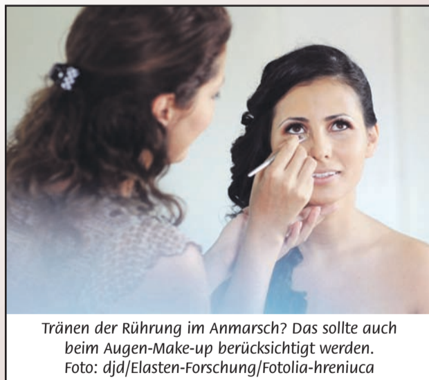
Tränen der Rührung im Anmarsch? Das sollte auch beim Augen-Make-up berücksichtigt werden.

(djd). Bei der Polterhochzeit wird meist keine aufwändige Dekoration verwendet. Einfach und schön ist das Motto. Dies kann man mit Luftballons, Lichterketten, Laternen, Wind- und Teelichtern ohne große Mühe umsetzen. Die Tische und das Buffet lassen sich etwa mit Streudeko wie Herzchen aus Holz verschönern. Mehr Tipps rund um