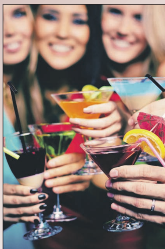
Nach dem Ja-Wort wartet die Polterhochzeit mit Freunden und Bekannten.

Hochzeit und Polterabend hat die Website www.hochzeit-perfekt-geplant.de , wer nach Rezepten für passende Cocktails sucht, wird unter www.ratgeberzentrale.de (Suchfunktion: "Cocktail") und auf www.bsi-bonn.de/geniessen/cocktails fündig.