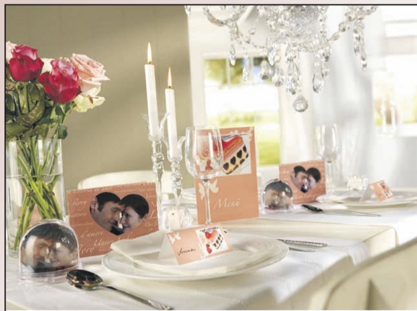
Schön, wenn auch die Gäste eine kleine Erinnerung mit nach Hause nehmen können. Fotosticker der Brautleute können die Gastgeschenke schmücken.

Stehen alle Verwandten und wichtigen Freunde auf der Gästeliste? Diese bange Frage beschäftigt wohl alle Brautleute. Wenn die Liste steht, ist es natürlich schön, keine Standardeinladungen zu versenden. Ansprechende und persönliche Einladungen sind einfach ein Muss und steigern die Vor-