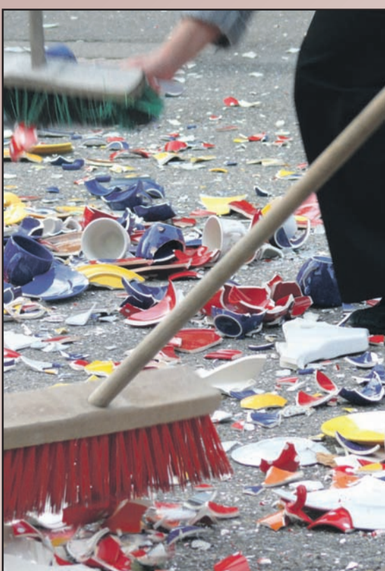
Die Polterhochzeit vereint den Brauch des Polterabends mit den Feierlichkeiten einer ganz normalen Hochzeitsfeier.

(rgz). Immer mehr Brautpaare wollen ihre Hochzeit nicht traditionell und gediegen mit relativ wenigen Gästen in einem Restaurant feiern, sondern ausgelassen und in einem ungezwungenen Rahmen. Eine Lösung dafür ist die Ausrichtung einer Polterhochzeit, welche die Bräuche des Polterabends mit denen der klassischen Hochzeit verbindet. Gefeierte wird zuhause, im eigenen Garten oder einer angemieteten Lokalität. Auch eine Polterhochzeit sollte gut vorbereitet sein, Tipps gibt es etwa unter www.polterhochzeit.org .