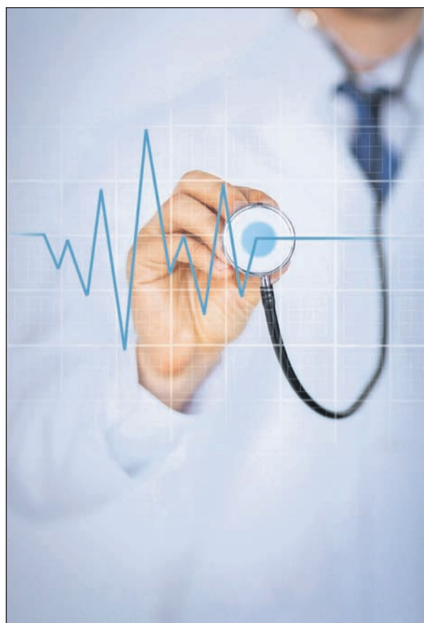
Wie tickt das Herz? Drohen Gefahren durch hohen Blutzucker oder Bluthochdruck? Das sollte ein Arzt ab dem 40. Lebensjahr regelmäßig überprüfen.

druck, Stress oder Diabetes können dem Herzen erheblich schaden und es krank machen, ohne dass wir davon etwas spüren. Ein beunruhigender Gedanke, der viele Fragen aufwirft: Woran kann man rechtzeitig erkennen, dass das Herz in Gefahr ist? Auf welche Weise lassen sich Risiken vorbeugen, die man über lange Zeit gar nicht bemerkt?