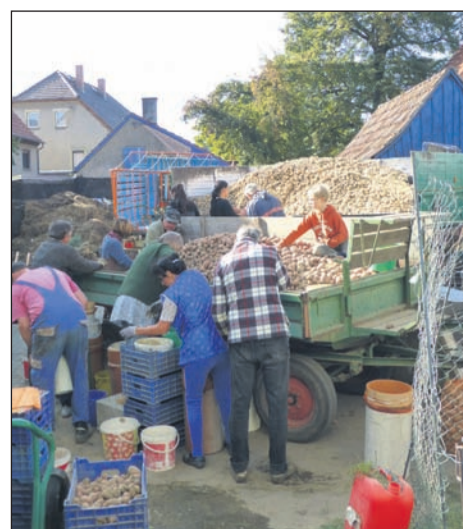
Familie und Freunde packen selbstverständlich bei der Kartoffel-Auslese und Einsacken auf dem Hof mit an.

werden diese Probleme zur absoluten Existenzfrage. Seifersdorf hatte früher um die 30 Bauernhöfe, heute sind es nur noch 2 produzierende und 2 im Nebenerwerb. 1972 gab es 100 Kühe im Dorf, heute sind es 19. In anderen Dörfern sieht es ähnlich aus.