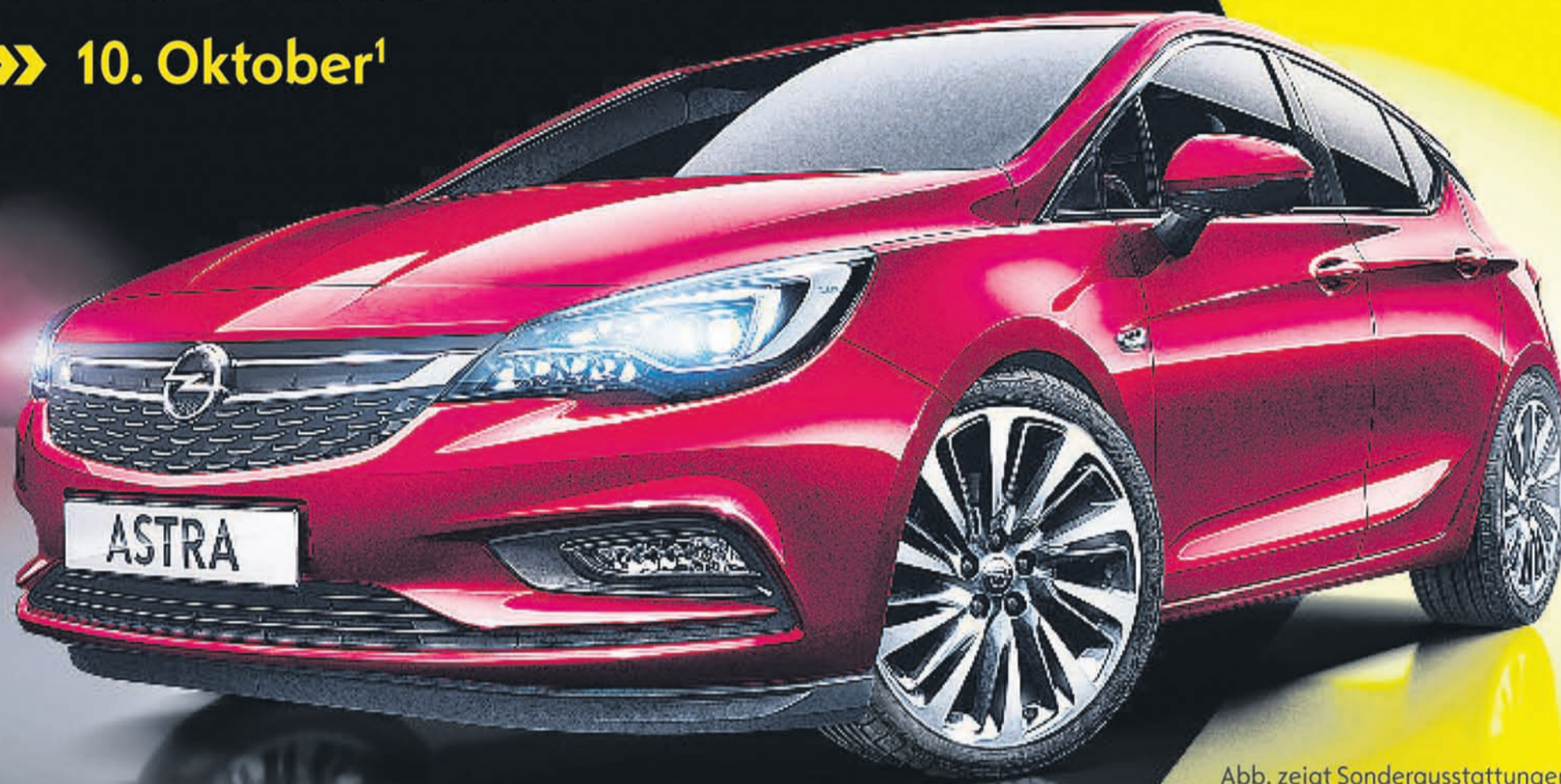
Abb. zeigt Sonderausstattungen.