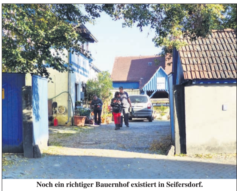
Noch ein richtiger Bauernhof existiert in Seifersdorf.

Gibt es wirklich keinen Grund zur Besorgnis? Oder wollen wir einfach nicht wahrhaben, dass wir uns Sorgen machen sollten und müssten? Wer beobachtet schon die erschreckende Verringerung der Anzahl der landwirtschaftlichen Betriebe, die fast täglich zunehmende Aufgabe von Bauernhöfen, die damit verbundene Brachlegung landwirtschaftlicher Nutzflächen? Wen schrecken solche Nachrichten noch auf, wie die vom 29. September 2015: Bauern legen ein Vielfaches ihres Ackerlandes still (Quelle: MDR 1 RADIO SACHSEN - Sachsen-Nachrichten um 13:30) In Sachsen haben Bauern in diesem Jahr deutlich mehr Ackerland stillgelegt als im vergangenen Jahr. Rund 12.000 Hektar seien nun Brachen, teilte das Landwirtschaftsministerium mit. Im Vorjahr seien es knapp 1.800 Hektar gewesen. Das Ministerium begründete die Entwicklung mit der EU-Agrarreform. Bauern würden bestimmte Prämien nur erhalten, wenn sie zusätzliche Anstrengungen unternähmen, die Umwelt zu schützen. Eine Möglichkeit sei, landwirtschaftliche Flächen stillzulegen.