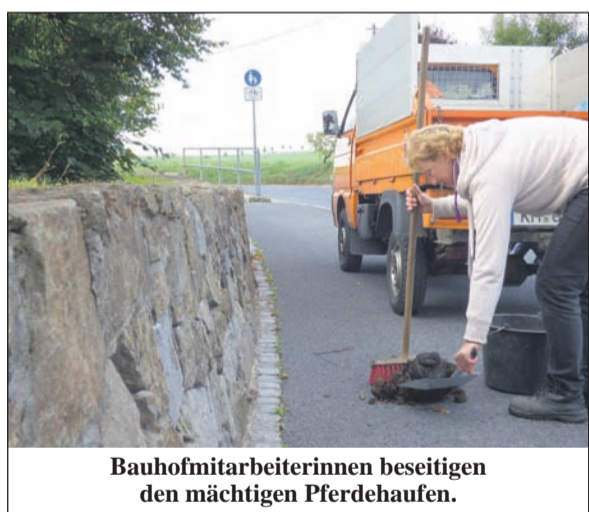
Bauhofmitarbeiterinnen beseitigen den mächtigen Pferdehaufen.

Hintergrund: Nach Paragraph 4 der geltenden Satzung der Gemeinde Wachau sind Tiere so zu halten, dass sie keine Menschen belästigen. Halter und Führer von Tieren haben außerdem dafür zu sorgen, dass ihre Verbeiner jedwede Notdurft nicht auf öffentlichen Straßen, Gehwegen und Plätzen sowie in öffentlichen Grün- und Erholungsanlagen verrichten. Denn, Kinder im Kita- und Schulal-