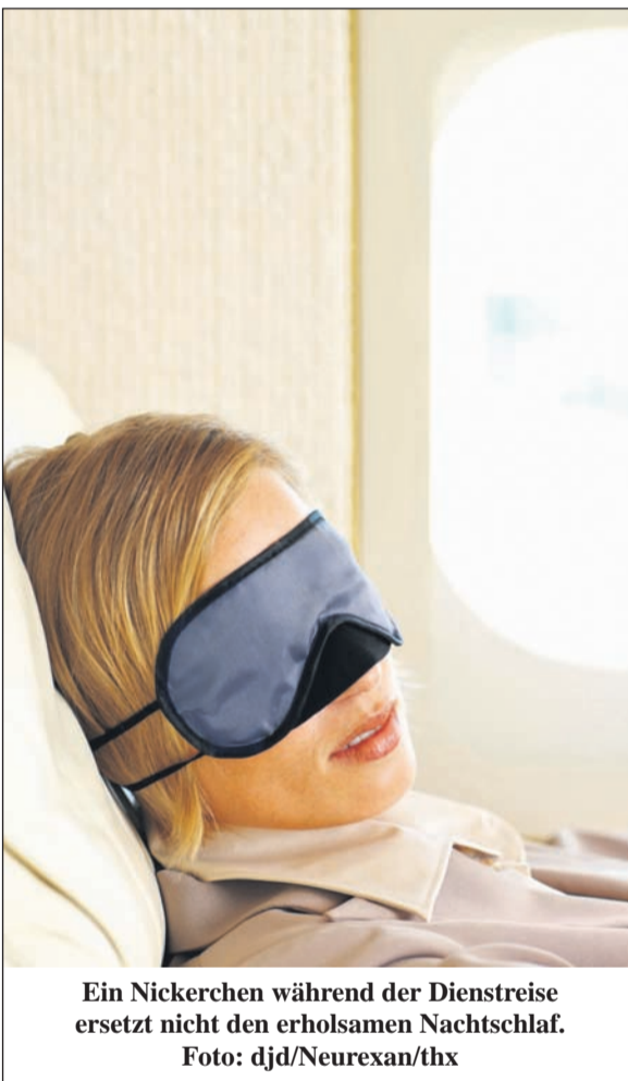
Ein Nickerchen während der Dienstreise ersetzt nicht den erholsamen Nachtschlaf.