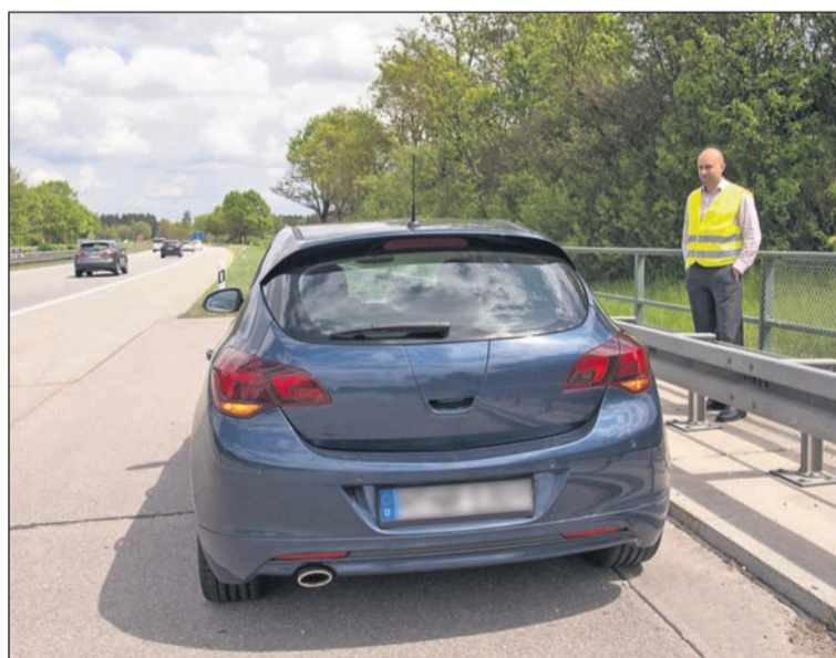
Ruhe zu bewahren ist eine der wichtigsten Regeln.