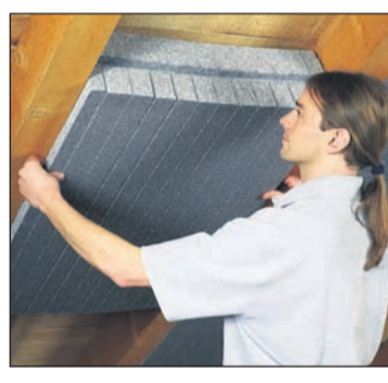
Von einer Wärmedämmung, etwa im Obergeschoss oder Dach, wird vor allem Langlebigkeit erwartet. Wichtig ist daher die Auswahl eines geeigneten Dämmstoffs wie Styropor.

Normen und schafft einheitliche, transparente Standards.