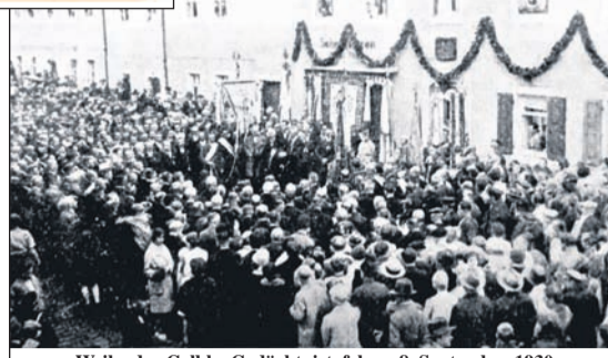
Weihe der Gelbke Gedächtnistafel am 8. September 1930 an Gelbkes Geburtshaus Stolpener Straße 7.

Das heißt sachlich kurz: Gelbke hat sein „Horch, die alten Eichen rauschen“ bereits vor seiner Abreise in die USA komponiert, ohne Heimweh, ohne Enttäuschungen, die wunderschöne Entstehungs-Geschichte ist also wirklich nur eine Legende. Unabhängig von dieser Ernüchterung ist Johannes Gelbke für sein umfangreiches Lebenswerk hohe Anerkennung zu zollen. Spürbar geworden ist das zuletzt anlässlich seines 100. Geburtstages am 19. Juli 1946, mit der Umbenennung des 1883 zwischen Dresdner Straße und damaliger Südstraße (Dr.-Albert-Dietze-Str.) angelegten Promenadenweges in „Gelbke-Hain“ und der Einweihung der dort befindlichen anfangs erwähnten Gedenktafel. In einigen Artikeln in Zeitungen und im „Radeberger Kulturleben“ ist sein Schaffen gewürdigt worden, ohne jedoch näher auf sein Leben einzugehen. Die größte Ehrung für ihn ist aber, dass sein berühmtes Lied als eines der ersten von der „Deutschen Grammophon“ um 1910 als Schallplatte produziert worden ist, auch heute noch fleißig gesungen wird und auch auf neuen CD's verlegt ist.