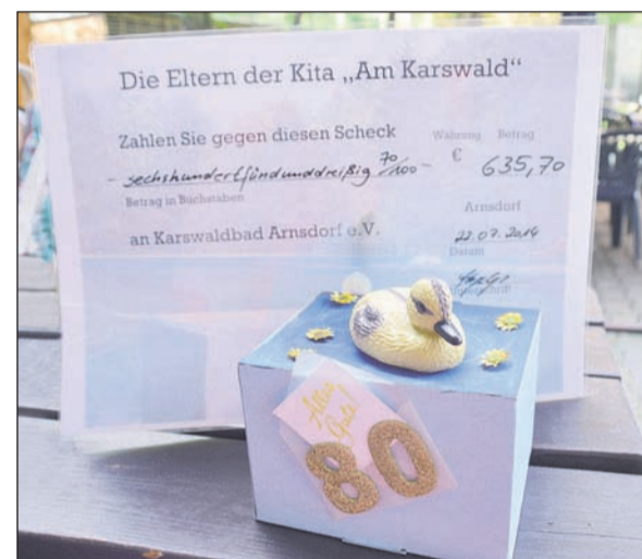
Hübsch verpackte Spende zum 80. Geburtstag des Karswaldbades. Übergeben hatte diese die Elterninitiative der benachbarten Kita Tausendfüßler.

Arnsdorf, dessen 80. Geburtstag vor ein paar Wochen gefeiert wurde, dringend nötig. Da die Gemeinde das Bad nicht mehr halten konnte, gründete sich der Karswaldbadverein aus engagierten Bürgern. Jedes Jahr aufs Neue kämpft der Verein um die Erhaltung des schönen Freibades. Nur durch die großzügigen Spenden hält sich der Verein buchstäblich „über Wasser“. Im benachbarten Kindergarten ist man froh über die Nähe zum Freibad und sammelt deshalb schon seit einigen Jahren. Auch der