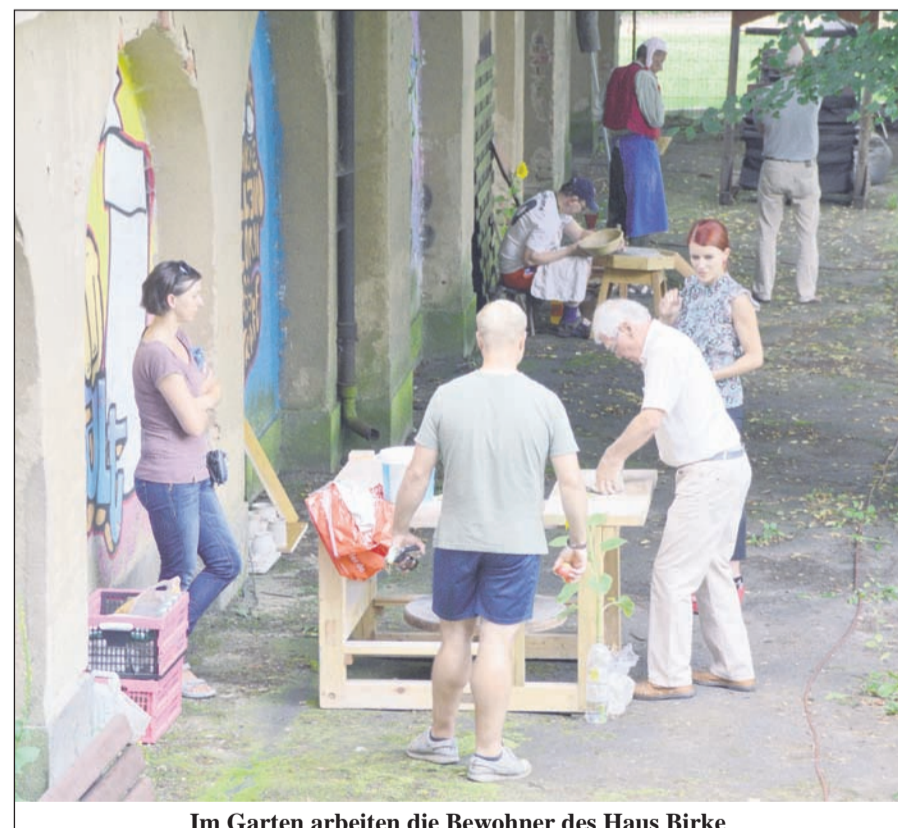
Im Garten arbeiten die Bewohner des Haus Birke mit einem Töpfer und dem Schmied.

Im letzten Jahr wurde, in Zusammenarbeit mit einem Holzbildhauer, die Figurengruppe „Schutz-Engel“ erarbeitet, die sich nun vor dem „Garten der Sinne“ befindet bzw. 2 Schutz-Engel das Haus „bewachen“. Während der Sommerwoche erfahren die Bewohner, dass es ein tief befriedigendes Gefühl ist, etwas zu erschaffen - egal ob allein oder ge-