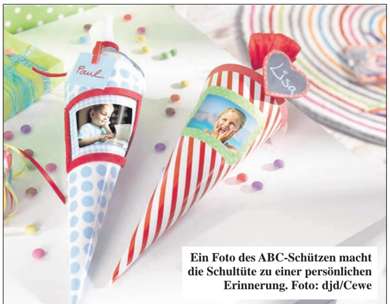
Ein Foto des ABC-Schützen macht die Schultüte zu einer persönlichen Erinnerung.