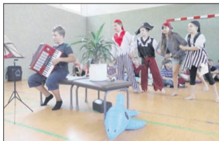
Text: Red.; Foto: J. Hanitsch

ter an ihren Grundschulen. Doch die nun verabschiedeten Viertklässler werden auf weiterführende Schulen gehen. Für sie ist die Entscheidung Gymnasium oder Oberschule längst gefallen und es wartet nach den Sommerferien eine spannende neue Zeit auf sie.