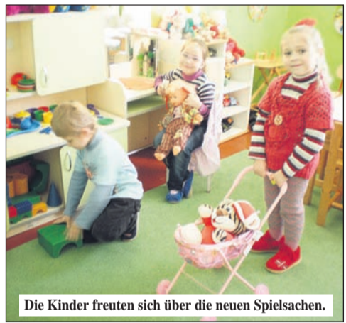
Die Kinder freuten sich über die neuen Spielsachen.