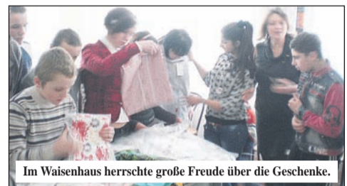
Im Waisenhaus herrschte große Freude über die Geschenke.

Für die freie Ukraine ist es noch ein Stück des Weges, aber die Kinder hatten Ihren großen Tag am Freitag, dem 07.02.2014. Die Mitglieder der Delegation brachten unter Leitung des Bürgermeisters Orest Trachyk die Spenden aus Radeberg. Diese Ladung Geschenke waren für die Kindergärten der Stadt, welche für solche Sachen kein Budget haben. Zwei Kindergärten und das Waisenhaus waren zu bedenken. Keine einfache Aufgabe, alles gerecht zu verteilen. Letztlich war es dann doch geschafft. Nach wenigen Minuten störten die Erwachsenen nur noch und auch für Fotos war jetzt nicht die „richtige“ Zeit. Die Kinder hatten Besitz ergriffen von ihren Geschenken. Auch im Waisenhaus herrschte eine große Freude. Hierher waren vor allem Kleidung und Schreibmaterial gegangen. Natürlich erzählten wir auch allen von dem Mädchen Chiara-Isabella und ihrer Initiative und dem Abgeordneten Arnold Vaatz. Bei einigen der Erwachsenen wurden die Augen feucht und sie baten mich die besten Grüße und einen großen Dank an alle