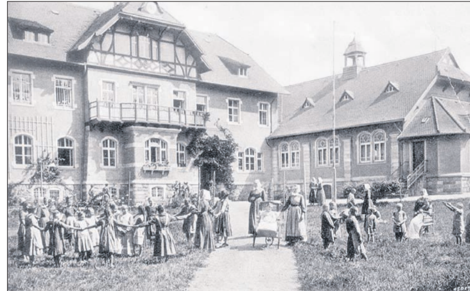
Vor dem Brunnenhaus - Diakonissen und Bewohner um 1925