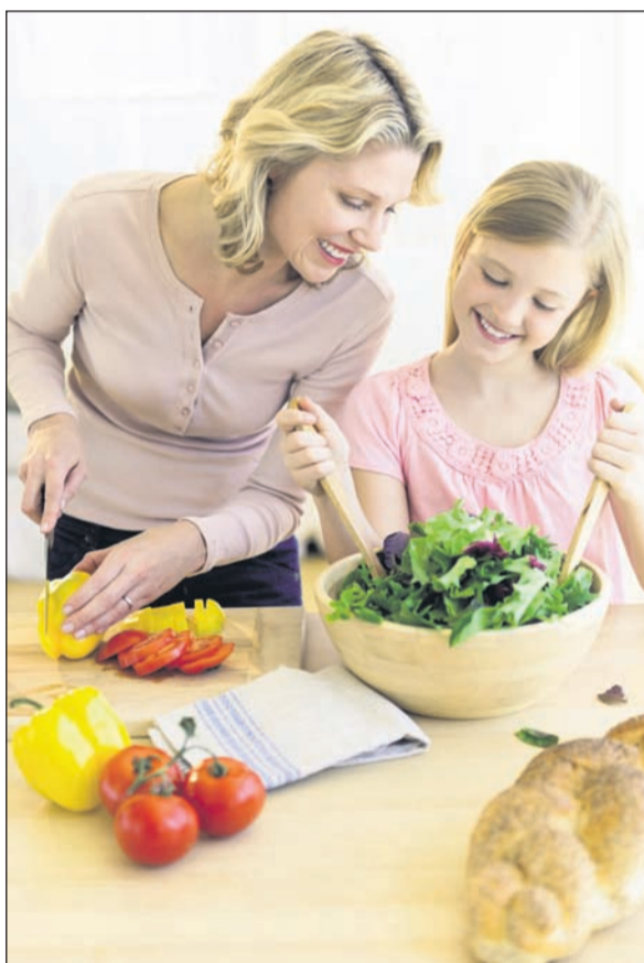
Der tägliche Bedarf an Vitamin D ist über die Ernährung allein nicht zu decken.

„wohlig Wärme“. Nehmen Sie viele Vitamine und reichlich Flüssigkeit zu sich. Ein natürliches Mittel gegen Erkältungssymptome ist Salbei. Bereits im Mittelalter verwendeten die Menschen das Kraut gegen Husten, Halsentzündung und Heiserkeit. Bei Erkältung lieber zu Hause bleiben: Auch wenn viele Menschen Angst davor haben, sich krank zu melden, ist es gerade bei einer Erkältung oder einer Viruserkrankung empfehlenswert, ein paar Tage zu Hause zu bleiben. Bereits das gemeinsame Benutzen des Telefons, der Griff an die Türklinke oder ein Händedruck kann die Viren per Tröpfchen von einem Kollegen zum Anderen weiterreichen und das Ansteckungsrisiko steigt enorm. Auch die Arbeitsleistung sinkt rapide und es kann zu Fehlern kommen. Fit mit Wechselduschen: Ein guter Tipp, um seinen Kreislauf in Schwung zu bringen, sind Wechselduschen. Brausen Sie Ihre Arme und Beine morgens ab-