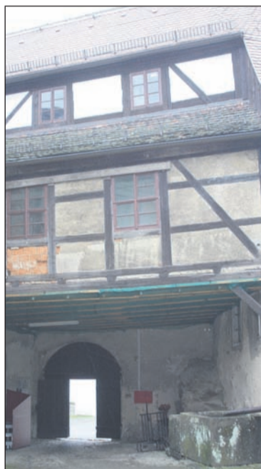
Die Decke des Torhauses ist bereits mit einem Netz gesichert. Hier soll bald gebaut werden.

Am 10. Februar gab das Staatsministerium für Wissenschaft und Kunst bekannt, dass für 23 regional bedeutsame Kultureinrichtungen in Sachsen zusätzliche finanzielle Mittel in Höhe von 2,5 Millionen Euro für Investitionen bereitgestellt werden.