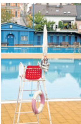
Das Becken ist leer, die Sonnenschirme - die Saison geht mit einem Abschlussfrühstück und Nieselregen zu Ende.