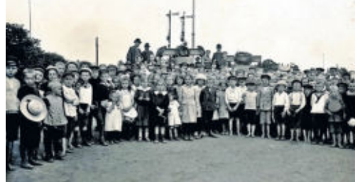
1918 Empfang der Glocken.

Die feierliche Weihe fand am Sonntag, dem 15. September 1918, in Verbindung mit dem Erntedankfest statt. Aus diesem Anlass versammelten sich bei schönstem Wetter am Nachmittag die Ortsvereine, Vertreter der Gemeinde, Kirche und Schule, die ältere Schuljugend sowie Einwohner am Gasthof „Zur guten Hoffnung“, um gemeinsam zur festlich geschmückten Kirche zu ziehen. Dort hatten sich schon Vertreter von Behörden, der Königlichen Landesanstalt und Nachbargemeinden eingefunden. Die Kirche war überfüllt und viele mussten draußen bleiben. Drin-