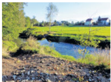
Blick von der Lotzdorfer Gemarkung („Kügelgen-Weg“ zum Augustusbad) auf Liegauer Auwiesen.

Eine Besonderheit der Eigentumsrechte an den Fluren des Augustusbades bestand darin, dass die rechte Seite des Taleinschnittes zu dem Dorf Wachau gehörte, die linke Seite war Lotzdorfer Flur, aber der Silberberg mit dem eigentlichen Tanngrund gehörte ehemals nicht zu Lotzdorf oder Liegau, sondern dem Rate zu Radeberg, der damit zuerst