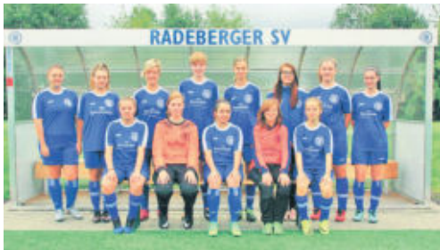
Die B-Juniorinnen des Radeberger SV