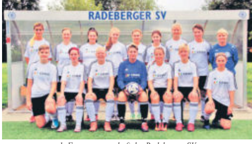
1. Frauenmannschaft des Radeberger SV