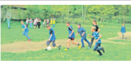
Belgien gegen Island, Island gewinnt.

gegen Mexiko 1:0. In der Zwischenzeit haben die Fans richtig gute und faire Spiel gesehen. Die Zuschauer feuern ihre Mannschaften an und malten sogar Plakate. Die Übersichtstabelle im Foyer ist stets belagert. In den Klassen wird diskutiert, wer wohl der endgültige Sieger sein wird. Diesen Spielern winkt als Trophäe ein Fußballpokal. Aber auch die anderen gehen nicht leer aus, denn jeder Verlierer bekommt einen Trostpreis. Spätestens zur WM-Eröffnung in Russland werden wir in unserer GS Süd wissen, ob unser Sieger Deutschland heißt.