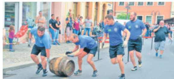
Beim Bierfassrollen holten sich die Thekenbrasilianer des RSV mit einer beeindruckenden Zeit von 1,52 Minuten den Sieg. Da kam Moderator Blumi nur schwer hinterher: