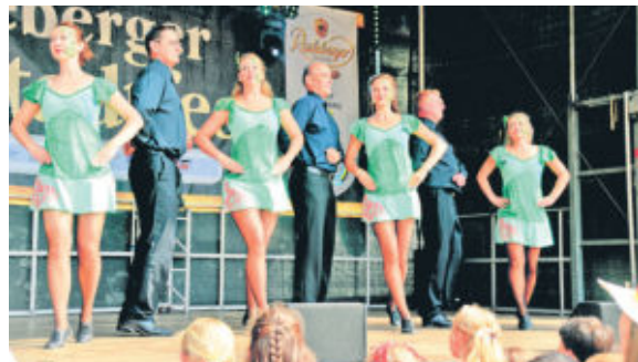
Auch beim Funkenflug räumten die Großerkmannsdorfer Karnevalisten ab. Mit ihrer irischen Darbietung des Riverdance, dem gemischten Tanzteam und den tollen Kostümen holten sie sich den Titel 2018.