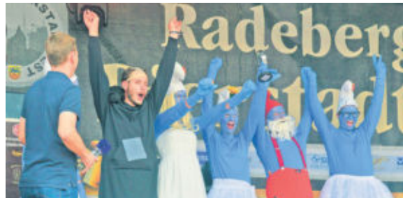
Der Kreativpreis beim Bierfassrollen ist zurück! Wohlverdient nahm der Karnevalsclub Großerkmannsdorf den Pokal mit nach Hause.