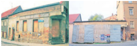
Bild links: Der Verfall im Jahr 1994. Bild rechts: 2008 - Auch der Beschlag mit Brettern und die Plakatierung können den Anblick nicht verschönern.

Einige Zeit tat sich nichts, an der Hauptstraße 24. Ein moderner Neubau soll hier Eigentumswohnungen im Zentrum bieten, dort wo einst der Gasthof Harmonie angesiedelt war. Eher in Erinnerung wird vielen das Textilgeschäft zu DDR-Zeiten geblieben sein, welches dann auch als letztes die Türen öffnete, bevor das geschichtsträchtige Gebäude dem Verfall preisgegeben wurde. Anfang 2015 erfolgte dann der lang ersehnte Abriss.