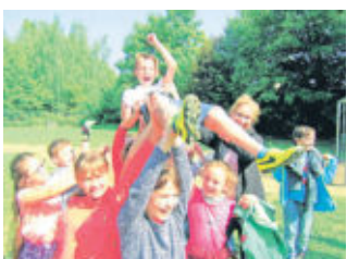
Die Sieger werden auf Händen getragen.

Passend zum Thema unserer neuen Schülerzeitung "Fußball-WM 2018" haben sich unsere Redakteure der "Coolen Schule" überlegt, in der Hofpause ebenfalls eine kleine Weltmeisterschaft zu veranstalten. Viele unserer Jungen und Mädchen sind begeisterte Fußballspieler und trainieren sogar im Verein. Zuerst verfassten wir einen Aufruf und verteilten Anmeldezettel in der ganzen Schule. Dort konnte sich dann eintragen, wer mitspielen wollte. 24 Mannschaften meldeten sich an und bekamen die Ländernamen ausgelost. Bei unserem 1. Match spielten Costa Rica