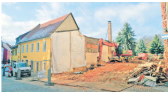
Die Abrissarbeiten von 2015.