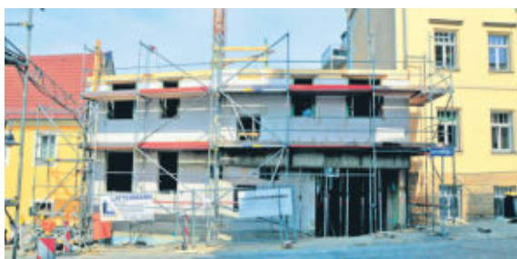
Die Bauarbeiten für das neue Wohnhaus sind aktuell in vollem Gange.

Ein Schandfleck verschwindet und wird durch einen modernen Wohnstandort ersetzt. Die typisch kleinstädtische Gaststätte, welche das historische Bild der Hauptstraße prägte, wird aber lange nicht vergessen sein, denn noch immer spricht man von der „alten Harmonie“.