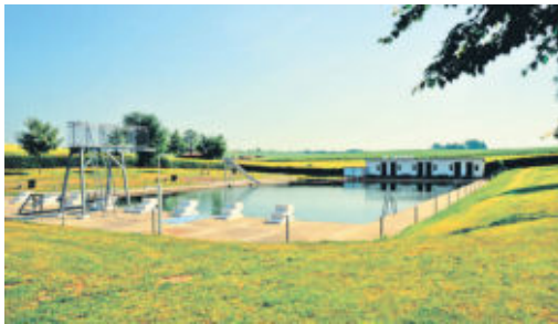
Bild unten: Im Freibad Wachau gehört nun eine neue Rutsche zum Inventar.

Die kleinen haben es bekanntlich ein bisschen schwerer. Freibäder mit ländlichem Charme, natürlichem Flair und langer Tradition findet man nicht mehr all zu viele. In den Gemeinden Wachau und Arnsdorf halten sich die Badestätten noch wacker. Wobei sich die Organisation rund um den sommerlichen Badespaß in Wachau etwas einfacher gestaltet, da sich das Bad in Gemeindehand befindet. In Arnsdorf kümmert sich der Karswaldbadverein liebevoll und mit viel Engagement um die Verwaltung des Areals. Nun hoffen natürlich beide Freibäder auf recht viele Besucher und das entsprechende Badewetter.