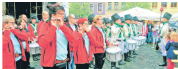
Der Spielmannszug marschiert ein. Beim Sternmarsch am Freitag spielten Oldies, Erwachsene und Kinder des Radeberger Spielmannszuges gemeinsam für die Besucher und stimmten damit auch auf ihr Fest zum 50. Jubiläum am 18. August 2018 ein.