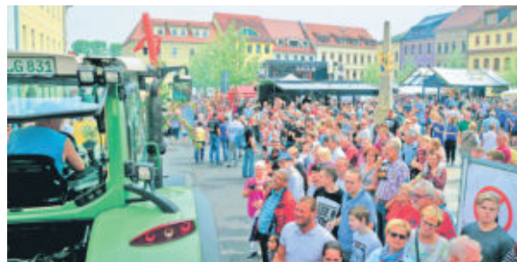
Klein aber Fein: Die Umzugsteilnehmer haben sich wieder viel Mühe bei der Gestaltung des Festumzuges gegeben.