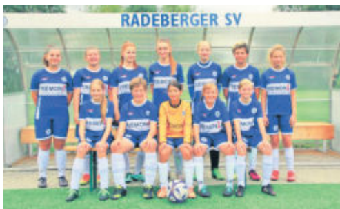
Die C-Juniorinnen des Radeberger SV

Nachwuchs wird quasi auch bei den Trainern selbst immer gern gesehen. Wie viele Spielerinnen trainieren den in den jeweiligen Altersklassen? Der Kader der 1. Frauenmannschaft verfügt momentan über 24 Spielerinnen. Die B-Juniorinnen haben eine Kaderstärke von 17 Spielerinnen und bei den C & D-Juniorinnen zählt das Team 12 Mädchen. Der weibliche Nachwuchs ist somit gut aufgestellt und weiter ausbaufähig. In welchen Klassen spielen den die einzelnen Teams? Wir sind stolz darauf, dass die C-Juniorinnen in der Landesliga spielen und einige Freundschaftsspiele bestreiten. Die B-Juniorinnen kämpfen neben den Freundschaftsspielen in der 2. Staffel der Landesklasse. Unsere Frauen kicken um den Landespokal, in der Landesklasse Ost und haben ebenfalls das ein oder andere Freundschaftsspiel. Übrigens ist die Frauenmannschaft fast komplett aus unserem eigenen Nachwuchs entstanden – darauf sind wir besonders stolz.