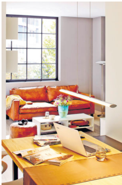
Eine ruhige Nische für das Home-Office einrichten? Auch das ist mit Trockenbauelementen problemlos möglich.

Zudem lassen sich die handlichen Platten ganz einfach verarbeiten: Entweder mit einer Stichsäge auf Maß bringen oder mit einem Cutter anritzen und über eine scharfe Kante brechen. Dann hat der Heimwerker die zugeschnittene Platte nur noch nach Anleitung auf der Unterkonstruktion zu befestigen und die Fugen zu verspachteln. Die Oberflächen lassen sich nach Wunsch gestalten. Um etwa den Fernseher oder auch Regale und Bilder an der Trockenbauplatte anzubringen, stehen spezielle Befestigungsmaterialien zur Verfügung. Das Material ist frei von gesundheitsbedenklichen Stoffen und nicht brennbar. Ausführliche Informationen und nützliche Tipps für die Veränderung des Zuhauses mittels Trockenbau gibt es unter www.knauf.de/diy/ im Bereich "Anwendungen - Trockenbauwände".