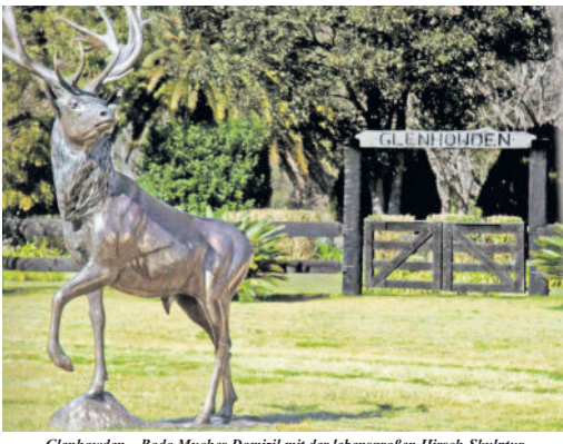
Glenhowden – Bodo Muches Domizil mit der lebensgroßen Hirsch-Skulptur.

Nach Ende des Zweiten Weltkrieges wollte es die geschichtliche Fügung, dass Bodo Muche im Osten des geteilten Deutschlands, der Sowjetischen Besatzungszone und späteren DDR, aufwuchs und seine Kindheits- und Jugendjahre verbringt. Er wuchs in dem kleinen, romantischen Haus in Radeberg am Obergraben Nr. 13 auf, welches die Eltern um 1946 erwarben und das sich direkt am Berghang unterhalb der Radeberger Kirche befand. Frühzeitig weckte der wissenschaftlich engagierte Vater, der ein eigenes Laboratorium (Institut) zur Herstellung von wissenschaftlich präpariertem Insektenmaterial betrieb, in ihm die Liebe zur Natur. Er nahm den Sohn mit zu gemeinsamen Erkundungen der näheren Heimat und förderte somit dessen bis heute anhaltende Faszination für die Schönheit jeglicher Lebewesen, die sich immer wieder in seinen Skulpturen und Bronzeplastiken widerspiegelt. Die Nähe zur Kunststadt Dresden, die mit ihren Galerien und Museen viele Anregungen und Möglichkeiten der bildnerischen Wahrnehmung und Weiterbildung ermöglichte, war der Auslöser für seine spätere Sichtweise, die eigenen Naturerlebnisse und -beobachtungen in künstlerische Ausdrucksmöglichkeiten umzusetzen. Seine besondere Zuwendung entdeckte er für die Skulptur als Darstellungsform, wobei er durch die figurlichen Plastiken, die in der Staatlichen Porzellanmanufaktur Meißen hergestellt wurden, ebenfalls entscheidende Impulse erfuhr.