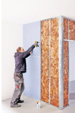
Modernisieren ohne viel Schmutz, und in kurzer Zeit: Trockenbauelemente bieten viele Vorteile.

(djd). Sind Trockenbauelemente stabil genug, um sogar einen Flachbildschirm zu tragen? Diese Frage stellen sich Heimwerker immer wieder. Doch diese Bedenken sind überflüssig. Selbst große Lasten von bis zu 60 Kilogramm kann eine doppelt beplankte Knauf Diamant-Wand tragen. Voraussetzung dafür ist die fachgerechte Befestigung mit den Hohlraumdübeln des Herstellers. Für geringere Lasten gibt es die Knauf Befestigungsschraube und den Gipsplattendübel.