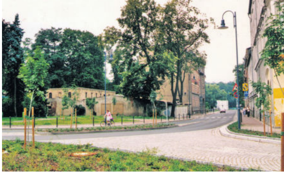
Blick in die August-Bebel-Straße 1993 und 2017.

Ende Januar holte sich der Kinder- und Jugendstadtrat Interessierte ins Boot, um an eigenen Ideen zu arbeiten, die die Interessen der jungen Zielgruppe widerspiegeln sollen. Auch die Radeberger Bürgerinnen und Bürger selbst, können mit ihren Einfällen und Ideen zum Erfolg beitragen. Ihre Anregungen, Hinweise, Wünsche oder Vorschläge können Sie per Email an bauamt@stadt-radeberg.de senden.