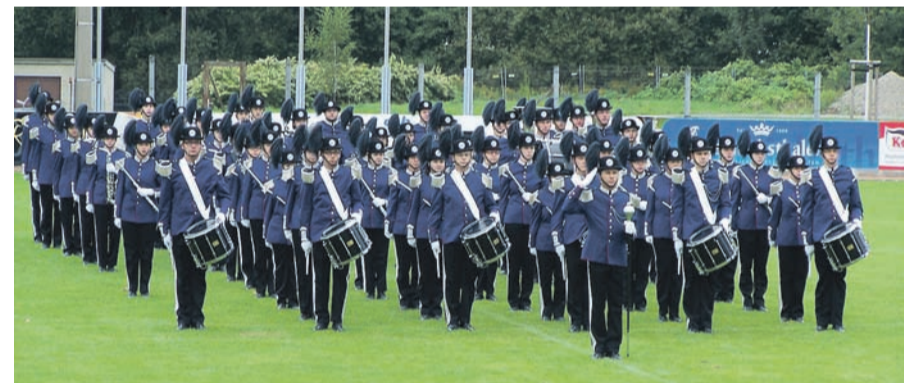
Das Marsch- und Drillkontingent des Spielmannszug Oberlichtenau bei der Musikparade 2012

Am Freitag ist wie immer die Eröffnung des Musikfestes als Radeberger Vereinsparty. Da freuen wir uns schon auf die Band „Simply Friends“, Showeinlagen des Karnevalsclub Großberkmannsdorf, der Radeberger Kindertanzgruppe und DJ Holm. Am Samstag dann die bestimmt wieder spannenden Wettkämpfe der Erwachsenenpielmannszüge und der großen Frage: Schaffen es unsere Erwachsenen, mit der