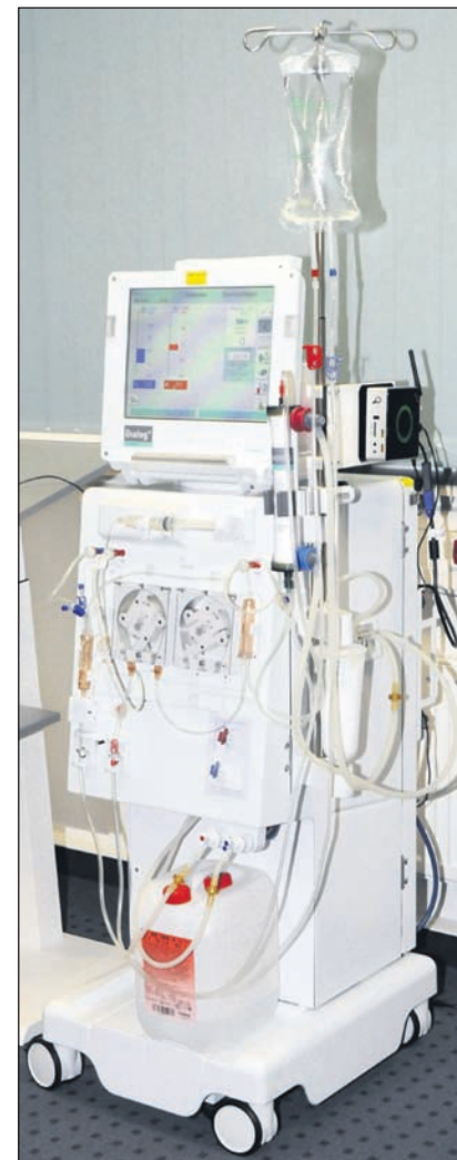
Dialysegerät von B.Braun aus dem Jahr 2003 bis heute.