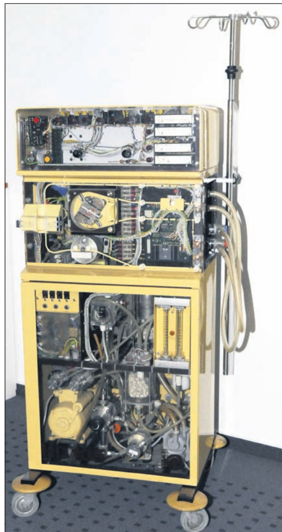
Dialysegerät von B.Braun ca. aus dem Jahr 1977/78.

lumen von durchschnittlich 1.700 Liter unseres Blutes verarbeiten, ein erwachsener Mensch hat durchschnittlich 7 Liter Blut – also unser Blut durchläuft die Nieren rund 240 mal, ist das Schwerstarbeit für dieses Organ. Die Hauptfunktion unserer Nieren liegt dabei in der Entgiftung des Blutes aber auch der Regelung des Blutdruckes, der Elektrolytkonzentration, des Knochenstoffwechsels oder auch des Wasserhaushaltes, um nur einige der wichtigsten Funktionen zu nennen. Wenn dann trotz aller Vorsicht bei einem Patienten eine Nierenerkrankung diagnostiziert wird, kann man sich an Hand der vorgenannten Zahlen gut verdeutlichen, was eine künstliche Niere (Dialysemaschine) für komplexe Aufgaben zur Blutreinigung leisten muss. An dieser Stelle setzte dann auch der zweite Teil der Informationsveranstaltung an, wobei die Gäste auf einem Stationsrundgang Wissenswertes von der ersten Entwicklung eines Dialysators im Jahre 1912 bis zur heutigen Fertigung modernster Technik am Radeberger Standort erfuhren.