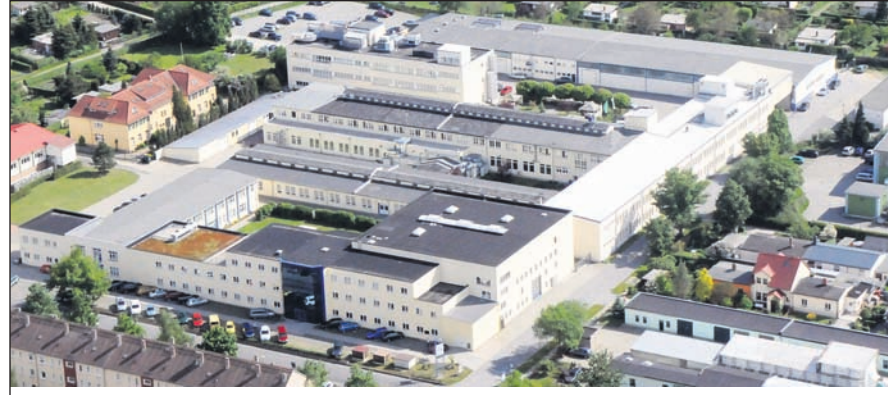
Produktionsstandort der B.Braun Avitum Saxonia GmbH in Radeberg.

ist steigend. Dabei können die Ursachen vielfältig sein. Zu den Hauptursachen zählen beispielsweise der Bluthochdruck, Gefäßverschleiß bzw. Verkalkung oder Diabetes sowie auch Nierenschädigung durch die längere Einnahme von Schmerzmitteln wie Ibuprofen. Vor dem Hintergrund, dass unsere Nieren täglich ein Vo-