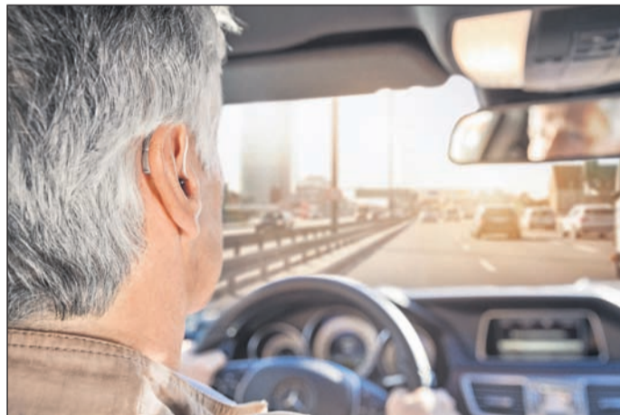
Neben guter Sicht zählt beim Autofahren vor allem ein gutes Gehör.

Moderne Hörgeräte haben beim Autofahren entscheidende Vorteile: Sie filtern störende Geräusche wie Motor- oder Reifengeräusche heraus, sorgen für entspanntes Hören und erleichtern so die Konzentration. Systeme wie das "Audeo V" von Phonak registrieren außerdem automatisch, woher eine Stimme kommt, ob vom Beifahrersitz oder von der Rückbank, und "zoomen" sie heran. Darüber hinaus gibt es auch Navigationssysteme für das Auto, die drahtlos mit dem Hörgerät verbunden werden können. So können beispiels-