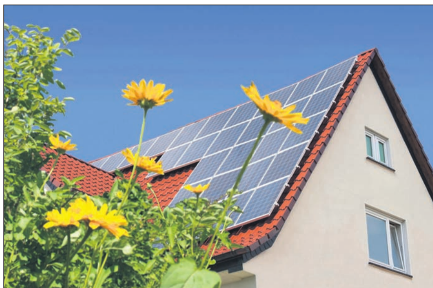
Der Strom, den die Solaranlage auf dem Dach erzeugt, kann in leistungsstarken Solarbatterien zwischengespeichert werden.

Auf dem Dach des Mehrfamilienhauses befindet sich eine Solaranlage. Im Keller brummt leise ein Blockheizkraftwerk und erzeugt neben Strom auch Wärme. Die Wärme wird in großen Warmwasserspeichern aufbewahrt und kann daher unabhängig von der Stromerzeugung genutzt werden. In einem weiteren Kellerraum stehen drei Hochleistungsbatterien, in denen der Strom, den die Solaranlage erzeugt, bei Bedarf zwischengespeichert werden kann. Vor der Tür parken außerdem noch zwei Elektroautos. Die Fahrzeuge können an eigenen Ladesäulen mit dem im Haus produzierten Strom betankt werden und dienen gleichzeitig als zusätzliche Stromspeicher.