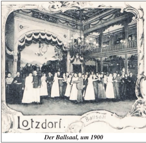
Der Ballsaal, um 1900