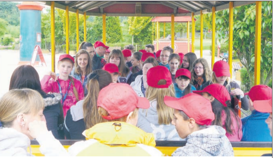
Den Abschluss bildete, finanziert durch den HGR-Erlös des genial-sozial-Projektes 2014, ein gemeinsamer Tag im Sonnenlandpark. Trotz Regenwetters hatten alle viel Spaß.

Begonnen hat dieses Projekt im Jahre 2013 während einer Besuchsreise mit einer Anfrage des Gymnasiums in Buda-Koschelewo. Mehrere Schüler aus verschiedenen Schulen im Kreisgebiet sollten zu einem landesweiten Deutsch-Ausscheid fahren. Diesen Schülern sollte die Möglichkeit gegeben werden, vorher noch einmal die deutsche Sprache nicht nur von ihren Lehrern zu hören. Natürlich haben wir zugesagt und gemeinsam mit den Schülern und einigen Lehrern eine Frage-Antwort-Runde durchgeführt. Daraus wurde der Gedanke an einen Schüleraustausch geboren. Bis zu diesem Zeitpunkt gab es zwar eine Schulpartnerschaft zwischen dem Humboldt-Gymnasium Radeberg und der Basisschule in Gubitschi, doch leider hat sich diese sehr einseitig gestaltet.