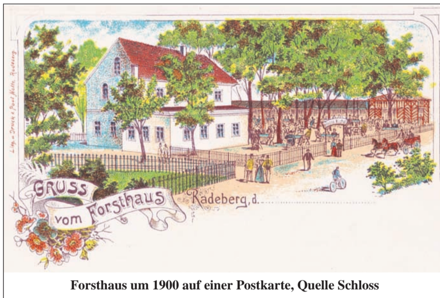
Forsthaus um 1900 auf einer Postkarte