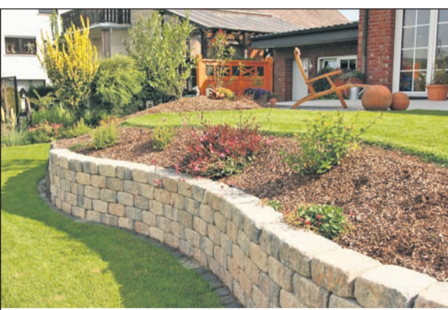
Gartengestaltung aus einem Guss: Steine und Bepflanzung bilden eine dekorative Einheit und werben das Freiluft-Wohnzimmer sichtbar auf.

(djd/pt). Immer mehr Bundesbürger zieht es in die Städte und Ballungsräume. Trotzdem wollen die wenigsten ganz auf frisches Grün verzichten. Denn ob meditative Entspannung im Liegestuhl oder ein gemütlicher Grillabend mit Freunden: Draußen sein tut einfach gut. Ein eigener Garten bietet die Möglichkeit, ein kleines Stück Natur ganz für sich allein zu haben. "Zugleich soll das Freiluft-Wohnzimmer allerdings auch dem persönlichen Stil entsprechen und eine behagliche Atmosphäre schaffen", sagt Martin Blömer vom Verbraucherportal Ratgeberzentrale.de. Mit geeigneten Materialien lässt sich bei der Gartengestaltung fast jede Vorstellung umsetzen.