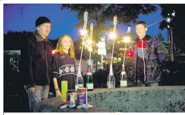
Sicher das neue Jahr begrüßen: Raketen und Böller sollten immer nur im Beisein von Erwachsenen gezündet werden.

kalender. Silvester wird an einem Neumond zwischen dem 21. Januar und dem 21. Februar gefeiert. Der nächste Neujahrstag ist der 15. Februar 2015.