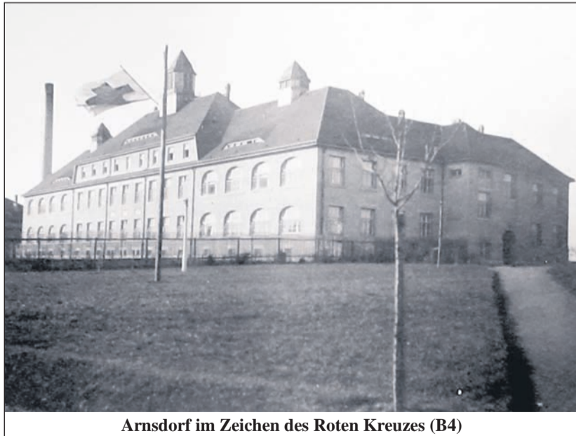
Arnsdorf im Zeichen des Roten Kreuzes (B4)

ten stiegen aus. Hilfsbereite geleiteten sie in die Warteräume des Bahnhofes. Hier wurde jedem Verwundeten ein Blumensträußchen überreicht. Auf langen Tafeln waren Körbe mit belegten Brötchen, Semmeln und Schüsseln mit heißen Würstchen aufgestellt, sowie Kannen und Krüge mit Kaffee, Kakao, Tee, Milch und dampfender Fleischbrühe. Auf einem Tisch standen Zigarren, Zigaretten und Streichhölzer. Auch die Schwerverwundeten, die in den einzelnen Wagen lagen, wurden nicht vergessen. Frauen und Männer des Hilfsvereins gingen von Wagen zu Wagen und bewirteten die Verwundeten. Inzwischen war die Sonne aufgegangen. Ein herrlicher Herbstmorgen mit klarblauem Himmel kündigte sich an. Die Leichtverwundeten verließen, nachdem sie gefrühstückt hatten, mit ihren Begleitern die Warteräume. Wer konnte, musste bis zum Lazarett laufen, viele hinkend mit Stock und Krücke. Die Schwerverwundeten wurden von Feuerwehrmännern in Särfen zu den bereitstehenden Wagen getragen. Auf dem Bahnhofsvorplatz standen im weiten Halbkreis die Arnsdorfer. Sie waren nicht bloß aus Neugierde gekommen. Mit Handkörben voller Paketen, Kistchen, Kästchen, Krügen, Gläsern, Tellern, Blumen, Früchten und Gebäck hatten sie sich eingefunden. Jeder Verwundete musste sich etwas nehmen oder bekam es in die Hand gedrückt.