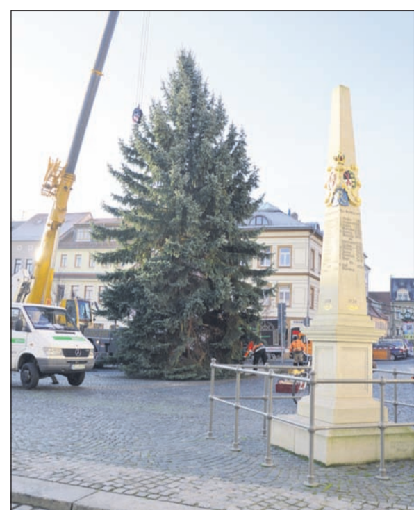
Text & Fotos: Red.