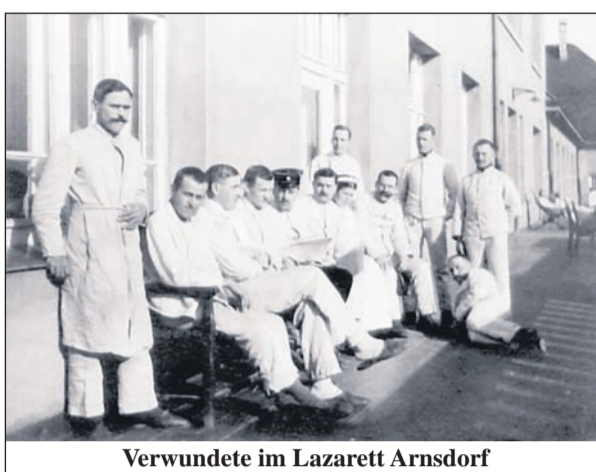
Verwundete im Lazarett Arnsdorf

Am 24. Oktober 1914 morgens 5.40 Uhr traf dann der erste Sanitätszug mit 386 Verwundeten in Arnsdorf ein. Ein Ereignis für den ganzen Ort. Pferdekutschen und Autos wurden während der Nacht bereitgestellt, Tragbahnen zum Bahnhof gebracht. Die Frauen des Vaterländischen Hilfsvereins trafen bis in die Nacht hinein Vorbereitungen zum Empfang der Verwundeten. Früh schon hatten sich hunderte Männer, Frauen und Kinder vor dem Bahnhof eingefunden. Kein Lärm war zu hören, als der Sanitätszug mit den roten Kreuzen auf weißem Untergrund einfuhr, keine Kriegsbegeisterung wie im August. Es war totenstill geworden. Die Eisenbahnwagen hatten auf beiden Seiten Plattformen, auf denen Krankenschwestern und Krankenpfleger standen. Als der Zug hielt, wurden die Türen an den Stirnwänden geöffnet. Die Leichtverwunde-