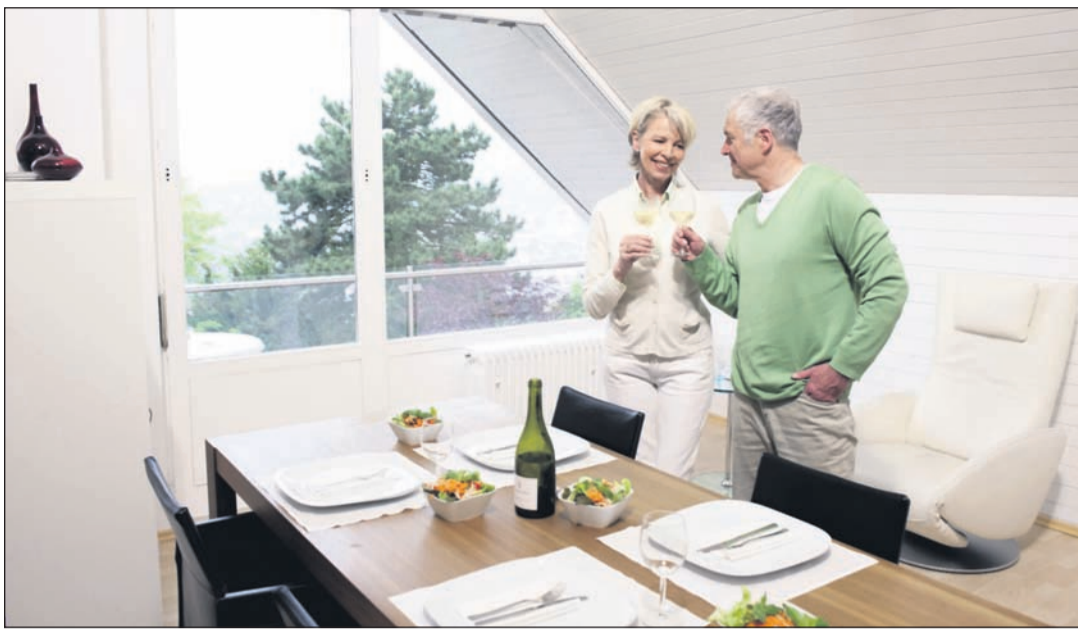
Hochleistungsdämmungen sorgen für angenehm temperierte Dachräume und angenehm niedrige Energiekosten.

(djd/pt). Niedrigstenergiehäuser sollen bereits bis zum Jahr 2021 der Standard im Neubau von Wohngebäuden werden. Damit werden die Anforderungen, die die aktuelle Energieeinsparverordnung (EnEV) 2014 an die Energieeffizienz von Immobilien stellt, auch weiterhin deutlich steigen. Ohne eine sehr gute Wärmedämmung läuft damit in unseren Breitengraden nichts mehr. Wer zukunftsorientiert plant und baut, der sollte bereits heute den Energiestandard anpeilen, der schon bald Gesetz werden wird. Das lohnt sich aus verschiedenen Gründen: Zum einen wird der energetische Standard eines Hauses künftig eine immer wichtigere Rolle bei der Bewertung von Immobilien spielen. Zum anderen bedeutet ein besserer Wärmeschutz weniger Heizkosten. Und nicht zuletzt gibt es staatliche Fördergelder etwa über die KfW Förderbank nur für Bauherren, die überdurchschnittlich gut bauen und die Mindestanforderungen der EnEV deutlich übertreffen.