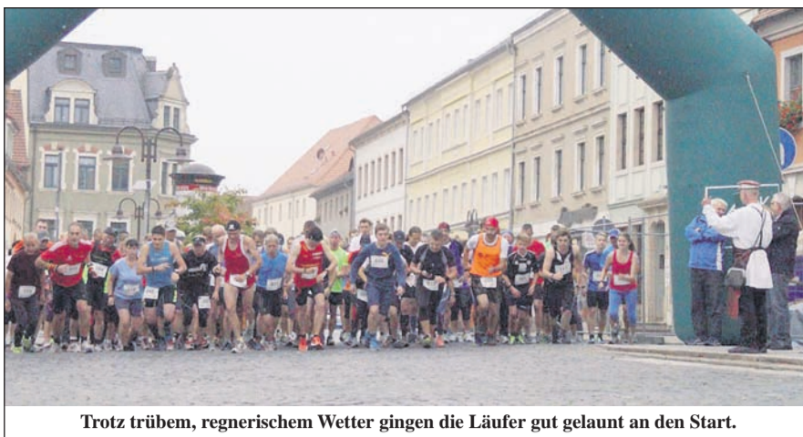
Trotz trübem, regnerischem Wetter gingen die Läufer gut gelaunt an den Start.