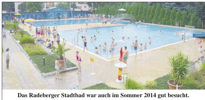
Das Radeberger Stadtbad war auch im Sommer 2014 gut besucht.

Genauso viele Tage umfasst eine Saison, in der das Stadtbad Radeberg geöffnet hat. Diese Tage sind nun schon wieder gezählt und die Tore geschlossen. Bevor jedoch der letzte Badegast das Gelände verlassen hat, lud der Stadtbadverein zum alljährlichen Abschlussfrühstück ein. Zusammen mit einigen Stammbadegästen wurde die Saison 2014 ausgewertet. Nach dieser Rechnung steht fest: 2014 war nicht so gut wie das Rekord- und Jubiläumsjahr 2013 - allerdings auch nicht sonderlich schlecht. Betrachtet man wiederum das Jahr 2012, sind die Zahlen 2014 dazu fast identisch. Insgesamt besuchten 26.138 Badegäste das Bad. Im Vergleich: 2013 kamen 5.932 Badegäste mehr ins Stadtbad. 2014 gab es natürlich auch einen Tag mit einem besonders großen Besucherstrom. Am 17. Juli schwammen 1.353 durch die Becken, brachen aber nicht den Besucherrekord von 2013 (1.428 Besucher am 20. Juni). Mit seinen extrem heißen Tagen lockte der Sommer 2014 an fünf Tagen über 1.000 Gäste in das Radeberger Bad - 2013 passierte dies an acht Tagen. Von den 123 Tagen einer Freibadsaison, gab es an 16 Tagen eine leere Kasse trotz Öffnung. Das Stadtbad wird aber auch für Feierlichkeiten vermietet, so waren es in dieser Saison 14 Feiern mit insgesamt ca. 550 Besuchern. Den Kinderschwimmkurs absolvierten 65 Kinder, wobei diese Zahl gegenüber dem Vorjahr sogar um sieben Teilnehmer gestiegen ist. Die Verantwortlichen des Stadtbades sind in jedem Fall zufrieden mit der nun zurückliegenden Saison und hoffen auf einen