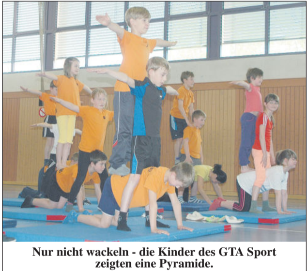
Nur nicht wackeln - die Kinder des GTA Sport zeigten eine Pyramide.

Vergangenen Samstag lud auch die Grundschule Wachau zum Tag der offenen Tür ein. Ab 14.00 Uhr konnten die Besucher die frisch sanierte Schule sowie den Hort besichtigen und nebenbei einladen erleben. Empfangen wurden die Gäste gleich zu Beginn um 14.00 Uhr vom Schulchor. Im Anschluss stellten sich die Kinder und Lehrerinnen der Ganztagsangebote Sport und Tanzen in der Turnhalle vor. Im Erdgeschoss der Schule konnten die