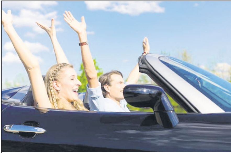
Endlich wieder Sonne und Fahrtwind genießen: Cabriofahrer freuen sich auf die warme Jahreszeit.

Doch bevor es bald soweit ist und die ersten Sonnenstrahlen nicht nur Motorradfahrer und Biker herlocken, sollte das Cabrio für die kommende Saison startklar gemacht werden. Nehmen Sie sich genügend Zeit für eine gründliche Pflege und eine Überprüfung der Funktionen am Verdeck. Im Winter fährt das Cabrio entweder nur geschlossen oder steht geschützt in einer Garage. Beides hinterlässt meist Schmutz, der entfernt werden muss. Wer auch im Winter mit seinem Cabrio fährt, sollte gerade darauf achten, Salzreste gründlich zu entfernen. Salz wirkt wie Schmirgelpapier und greift das Material und die Dichtungen des Verdecks an. Besonderer Pflege bedarf ein Stoffverdeck. Kunststoff- oder Metallverdecke lassen sich wie den Rest des Autos waschen. Ein wichtiger Hinweis bei der Reinigung von Stoffverdecken ist: Keinen Hochdruckreiniger verwenden. Dieser kann im schlimmsten Fall das Dach aufreißen und die Imprägnierung zer-