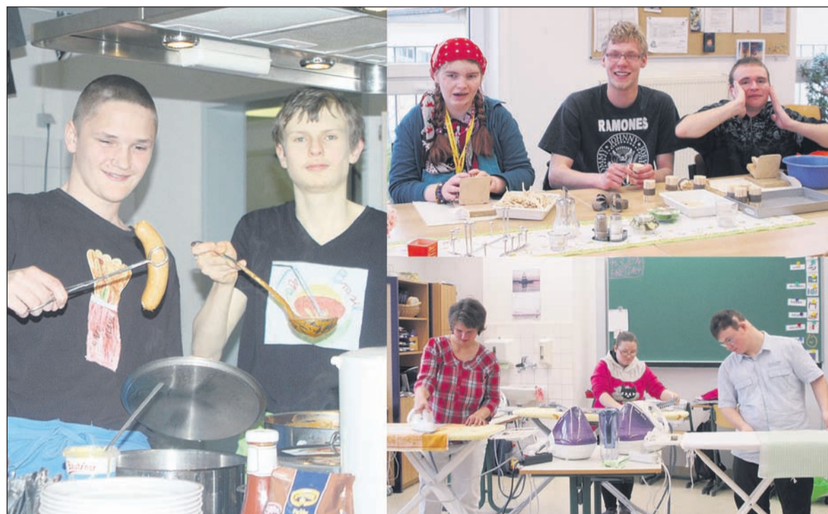
Suppe, Wurst und Getränke boten die Schüler im Café Brasil an (links), bei der Herstellung von K-Lumet bzw. Feueranzünder ist viel Geduld gefragt (rechts oben), viel Dampf machten die Jugendlichen in der Bügelgruppe (rechts unten)

Mit Freude und Stolz präsentierten die Kinder und Jugendlichen der Förderschule in Kleinwachau am Freitag, den 28. März ihre Räumlichkeiten, Unterrichtsarbeiten sowie ihr Können. Jeder interessierte Bürger konnte dem Unterricht einmal beiwohnen und sich außerdem überall im Schulhaus umsehen. Der Tag der offenen „Klassenzimmertür“ stand unter dem diesjährigen Motto der Förderschule „Kunterbunt“. Themen der einzelnen Klassen waren unter anderem; Bunte Frühlingsblumen; so bunt wie unser Körper; Tageszeiten; Wochentage auf dem Markt; Zauberer von Oz; die Schülerfirma; K-Lumet Herstellung und Vögel im Frühling. Das Schuljahresthema soll vor allem die Vielfalt in der Gesellschaft