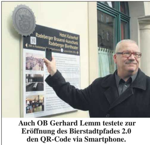
Auch OB Gerhard Lemm testete zur Eröffnung des Bierstadtpfades 2.0 den QR-Code via Smartphone.

Mit einem Pfiff in seine Trillerpfeife eröffnete Radebergs Oberbürgermeister, am Dienstag vergangener Woche, den Bierstadtpfad 2.0.